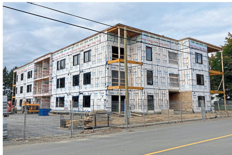
Les investissements ont dépassé le cap des 50 millions $ au cours de l'année 2024 à Plessisville.

En décembre, le Service de l'urbanisme a délivré 15 permis, représentant une valeur totale de 781 776 $. Les faits saillants de ce mois incluent principalement des