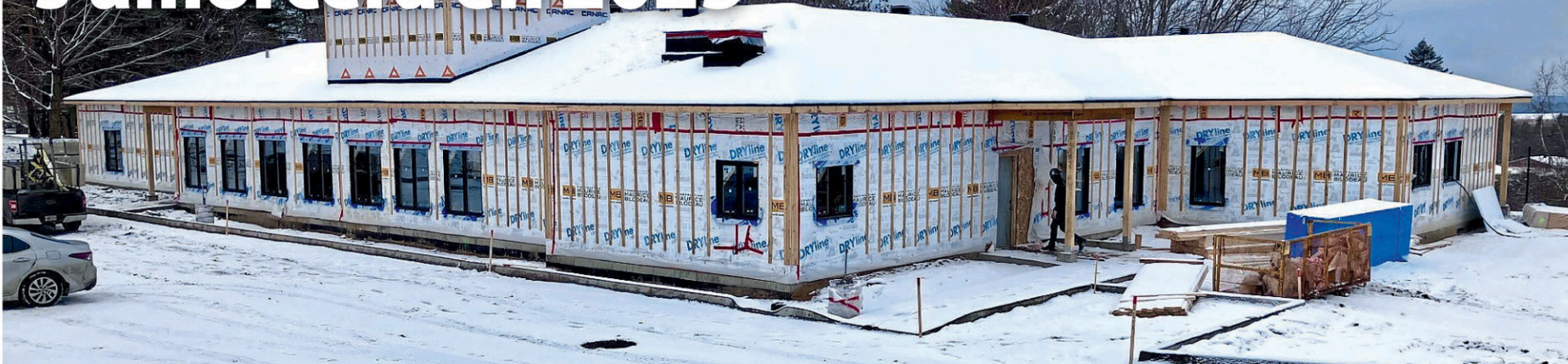
Les travaux du nouveau Centre de la petite enfance La Petite Bande, situé dans le futur développement domiciliaire, avancent rondement. Voici une photo prise en décembre 2024.