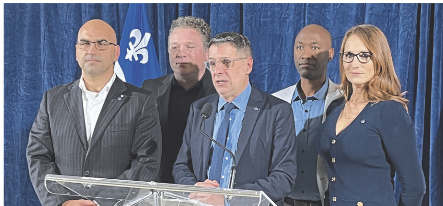
Le chef Éric Duhaime lors du congrès national de son parti en novembre à Victoriaville

Le sondage a été effectué à partir d'appels faits par réponse vocale interactive.