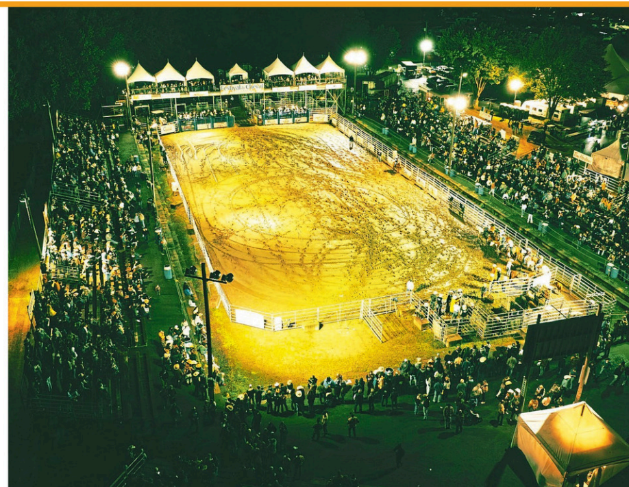
Une programmation des plus divertissantes attend les festivaliers du 23 e Festival du cheval de Princeville, du 5 au 8 juin, à Princeville.

Une première pour le Festival du cheval qui vous réserve un spectacle époustouflant de sauts acrobatiques en moto-cross avec Milot Land le jeudi 5 juin en soirée. De plus, l'Académie Milot Land sera sur place samedi et dimanche pour initier gratuitement les jeunes de 4 à 13 ans à leurs premiers tours de moto-cross (100% électriques) dans un cadre sécuritaire. Le samedi 7 juin sera une journée bien remplie au Festival du cheval comme d'habitude. Les portes du site ouvriront tôt et plusieurs artisans et kiosques seront accessibles. Diverses activités équestres auront aussi lieu dans le manège. La présentation de la traditionnelle grande parade Gaston Roy aura lieu en début d'après-midi. Cette parade regroupe plusieurs