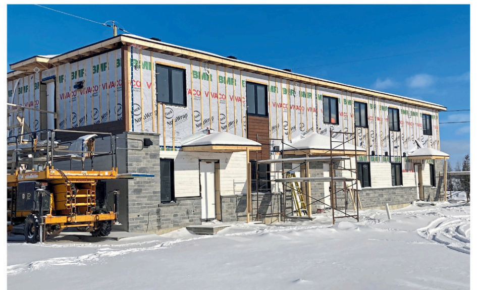
Le secteur résidentiel a battu des records en 2024 avec la construction de 77 nouvelles unités résidentielles et des investissements de 13,6 millions $.

Une population en constante augmentation (avec 6460 habitants et des perspectives de croissance prometteuses)