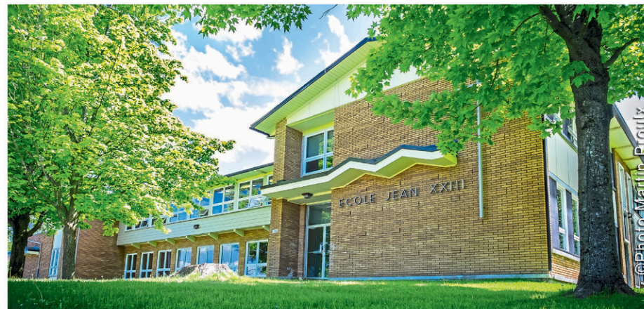
La rentrée scolaire 2025-2026 se fera à l'école primaire Sainte-Julie de Laurierville pour les élèves de l'école Jean-XXIII d'Inverness.