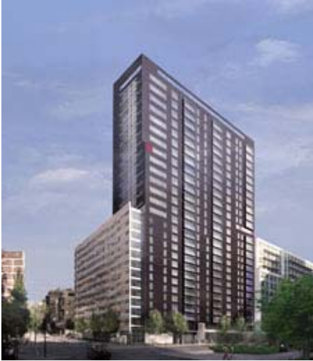
Maquette du Louis Bohème

La construction immobilière à Montréal semble vouloir maintenir son rythme des dernières années et un autre important projet a été annoncé, cette fois dans le secteur du Quartier des spectacles .