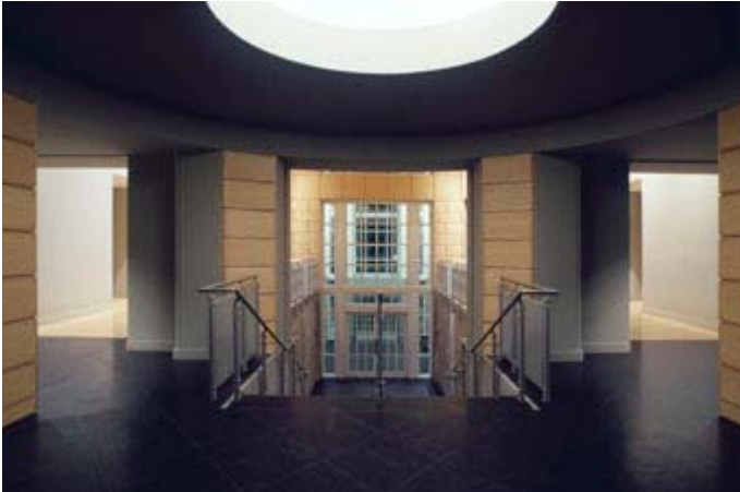
Hall d'accueil du Centre Canadien d'architecture