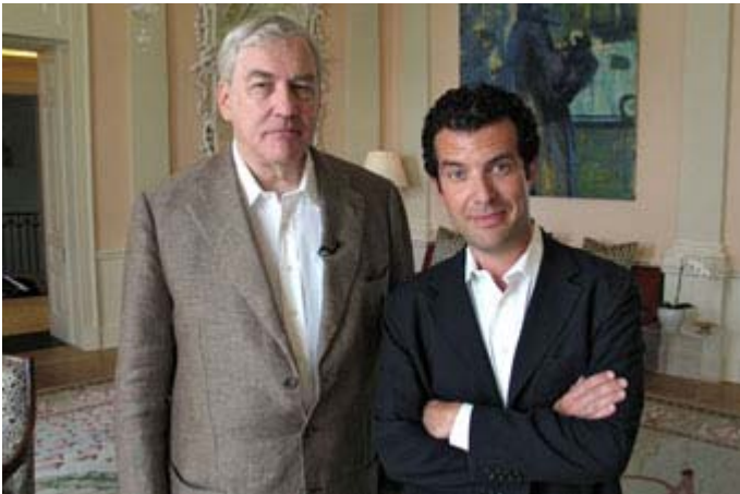
Conrad Black et Rick Mercer