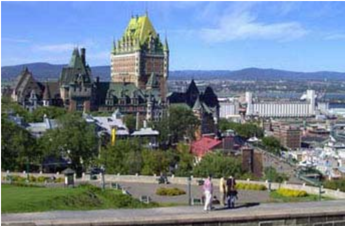
Vue du Château Frontenac à Québec