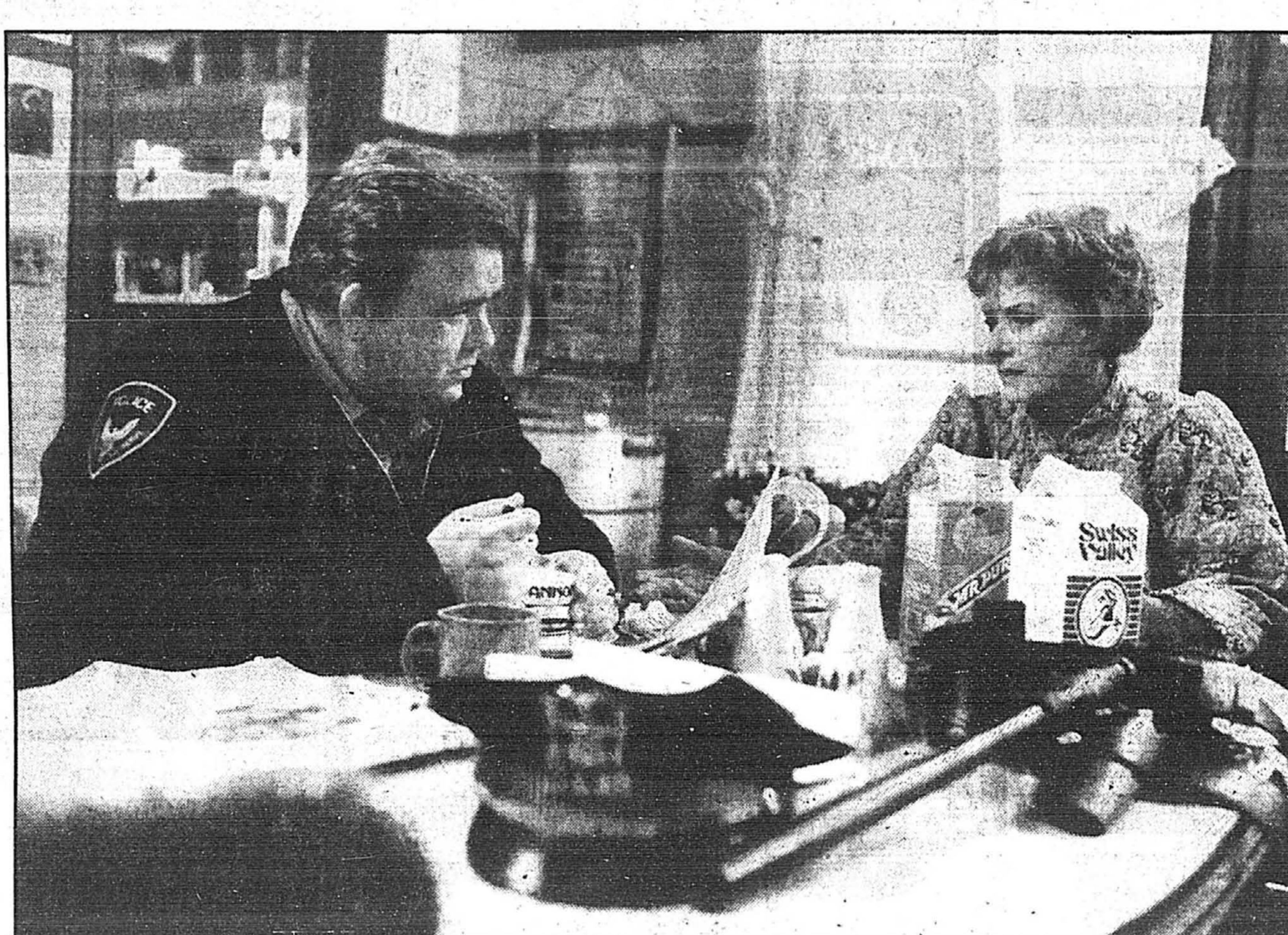
Dans Only the Lonely, John Candy incarne un brave policier qui vit depuis toujours à Chicago avec sa mère acariâtre et autoritaire, un rôle tenu par Maureen O'Hara.