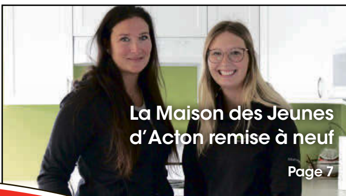
La Maison des Jeunes d'Acton remise à neuf