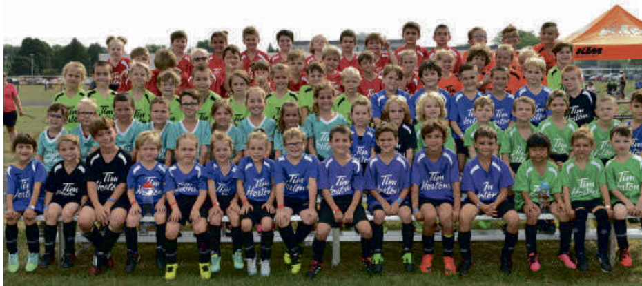
Plusieurs joueurs U6 et U8 ont participé au tournoi et assisté aux différents matchs présentés.