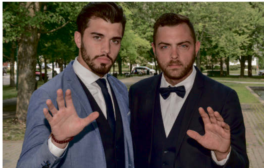
Les fils de Messmer, qui forment le duo Les Somnifères, se produiront à la Paroisse Saint-Jean-Baptiste de Roxton Falls, le 2 septembre, pour un spectacle-bénéfice.

Les billets sont vendus au coût de 20 $ chacun au bureau de la paroisse, auprès des marguilliers, dans les stations-service Shell et Sonic d'Acton Vale et au camping Wigwam d'Upton.