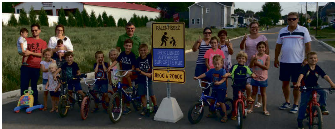
La Municipalité de Wickham a récemment lancé son projet « Dans ma rue on joue », avec un encadrement sécuritaire pour tous les citoyens.

La Municipalité de Wickham lance un message positif grâce à son projet « Dans ma rue on joue » : tous les citoyens ont leur place dans les rues résidentielles choisies.