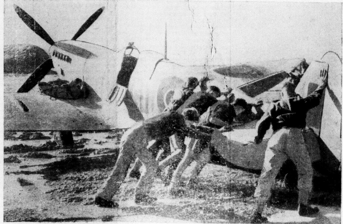
Il n'est pas facile de déplacer un Spittore sur un terrain d'atterrissage transformé en marécage par la pluie incessante, en Italie.