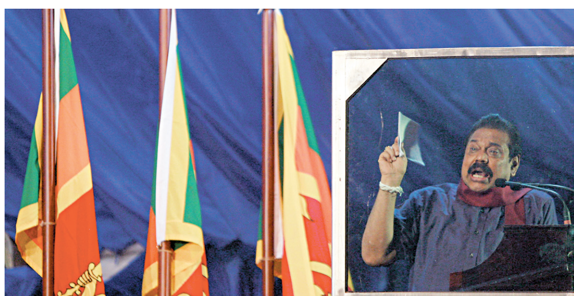
Le président Mahinda Rajapaksa n'est pas assuré de sa réélection.

New Delhi — La rue sri lankaise, celle de la majorité cinghalaise et bouddhiste qui compte pour 75 % de la population, est plus ambivalente qu'il n'y paraît par rapport à Rajapaksa. Elle lui est indubitablement reconnaissante d'avoir mis fin à 26 ans de guerre civile en décapitant l'organisation indépendantiste et radicale des Tigres tamouls. Les gens veulent croire que la guerre est finie pour de bon. On respire plus à l'aise à Colombo, la peur qu'à tout instant un attentat suicide soit commis s'est magiquement évaporée... En même temps qu'on n'est pas dupe de la nature du gouvernement sri lankais: Rajapaksa, disent aussi les gens, a perpétué la culture de corruption et de népotisme qui caractérise le fonctionnement de l'État et n'a, finalement, rien fait pour développer l'économie et créer des em-