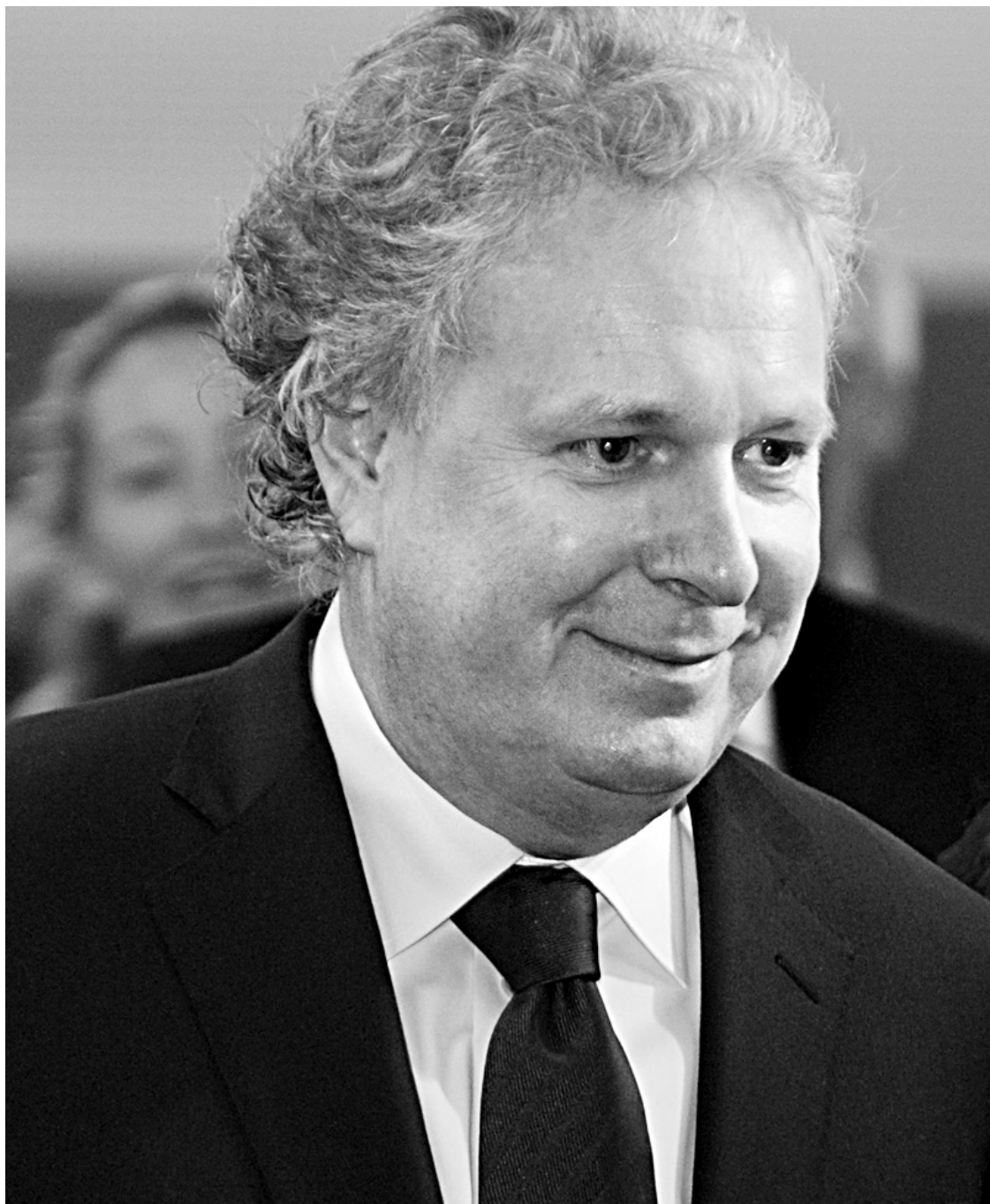
Jean Charest a fait dans la prospective cette semaine à Lévis.

Jean Charest a déclaré qu'il voulait que le Québec devienne «la puissance nord-américaine des énergies propres» en se fixant l'objectif, par exemple, de se distinguer en étant «la première société d'Amérique du Nord à électrifier son parc automobile et ses transports publics».