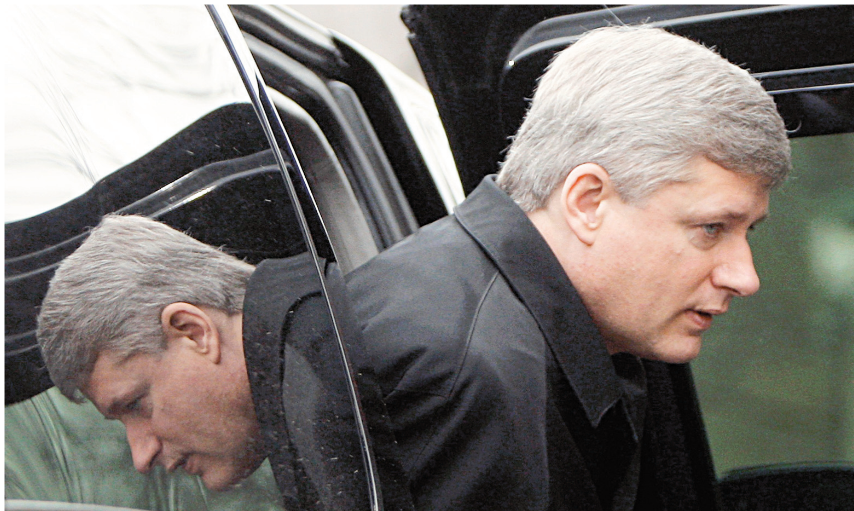
Le premier ministre, Stephen Harper, a son arrivée à Rideau Hall mardi pour annoncer le remaniement ministériel.

En 1998, il dépose le premier budget de son cru, dans lequel il accorde un milliard de dollars