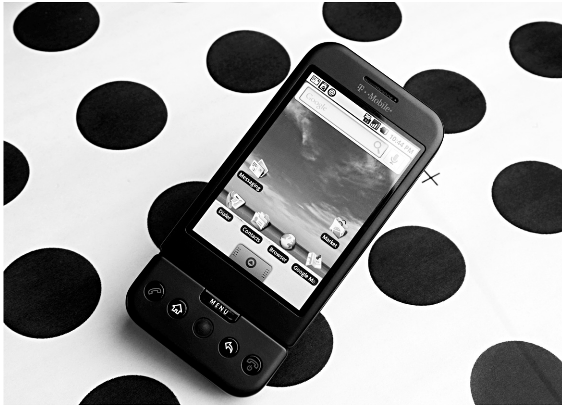
MIKE BLAKE REUTERS

Cette matérialisation d'un composante de l'empire de la recherche est toutefois délicate, assure Jean-François Ouellet, professeur de marketing et spécialiste des nouveaux produits à HEC Montréal. «Google fait face aux mêmes écueils que