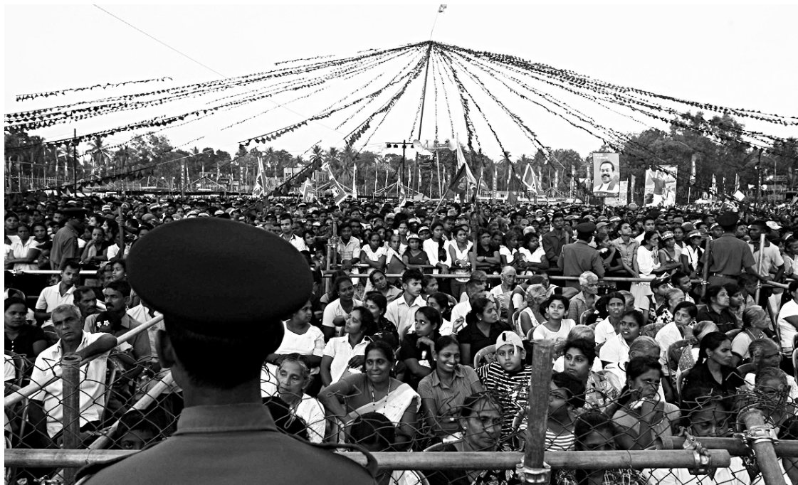
Des partisans du président Rajapaksa lors d'un meeting électoral à Nittambuwa.