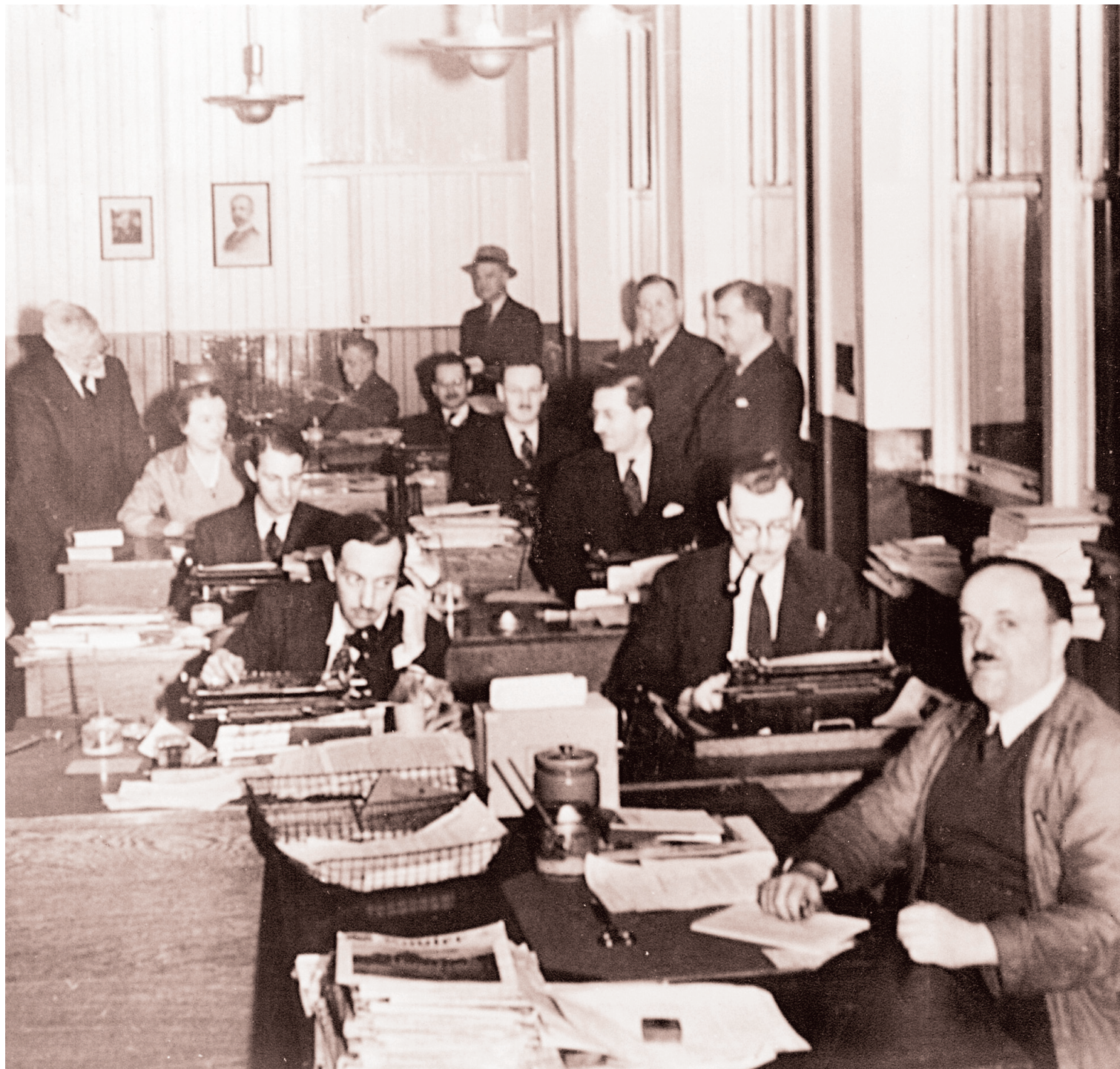
La salle de rédaction du Devoir ... à une autre époque.

«Le Conseil législatif siège rarement, poursuit-il. Comme les conseillers n'ont pas d'électeurs à soigner, ils n'éprouvent nullement besoin de faire des discours, et c'est autant de rhé-