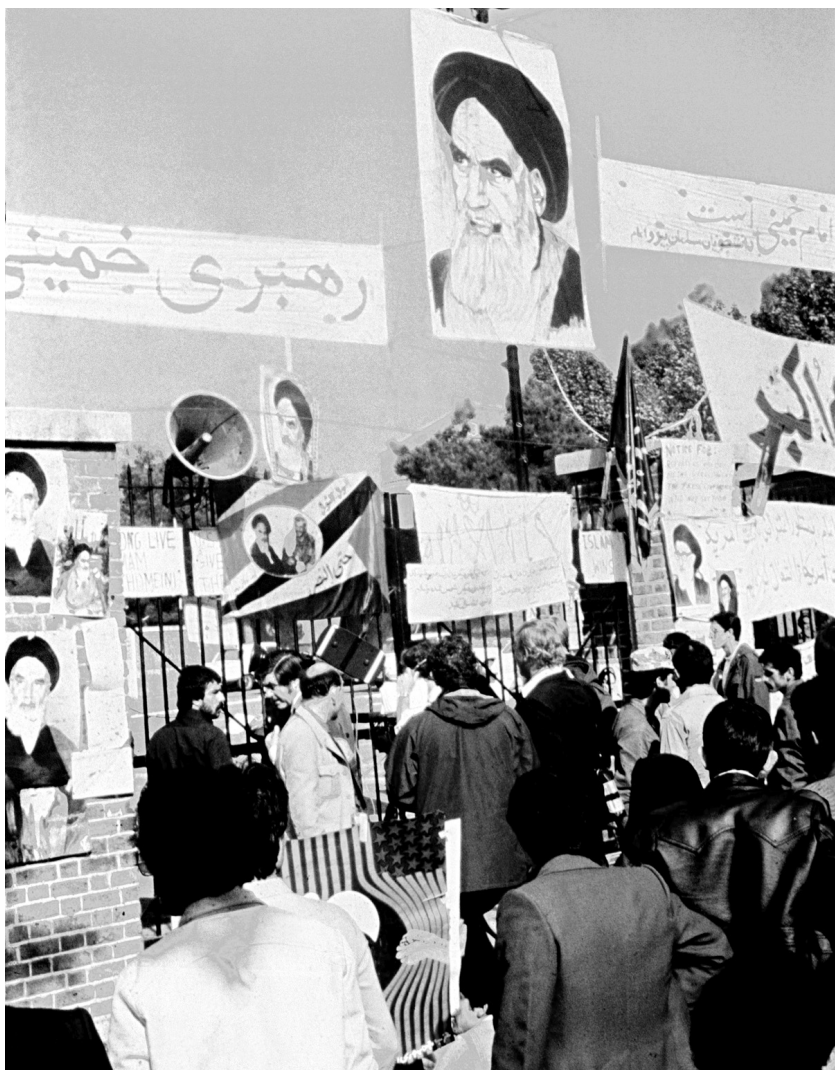
Des partisans de l'ayatollah Khomeiny manifestent en novembre 1979 devant l'ambassade américaine, qui est déjà occupée depuis quelques jours par des activistes.