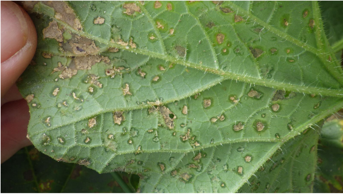
Photo 12 : Lésions de mildiou à la face inférieure d'une feuille de melon brodé Lésions de formes irrégulières, dont les contours sont d'apparence huileuse. La sporulation mauve n'est pas visible à l'œil nu.