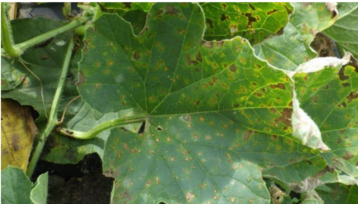
Photo 11 : Lésions de mildiou à la face supérieure d'une feuille de melon brodé

En début d'infection, de petites taches de forme irrégulière, plutôt ronde, souvent entourées d'un halo jaune canari apparaissent. Contrairement au concombre, il n'y a généralement pas de duvet noir violacé à la face inférieure de la feuille, car la sporulation est quasi absente.