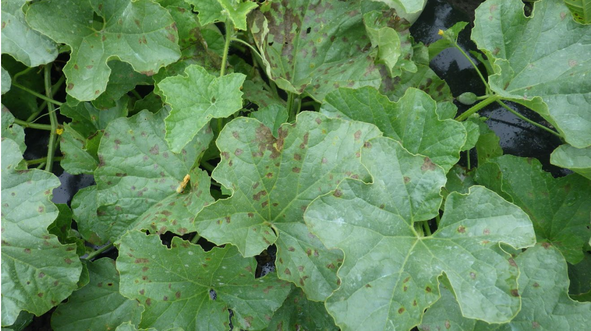
Photo 16 : Lésions causées par le mildiou sur le melon brodé, 1 er septembre 2020 Les lésions finissent par se nécroser si le temps reste humide et pluvieux longtemps.