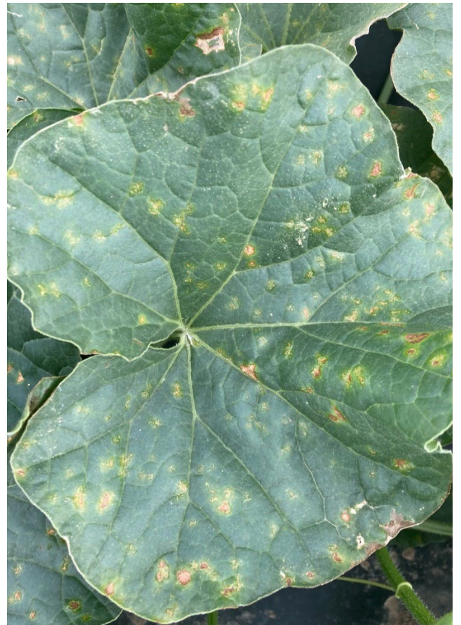
Photo 14 : Vue rapprochée des lésions plutôt rondes, entourées d'un halo jaune, causées par le mildiou