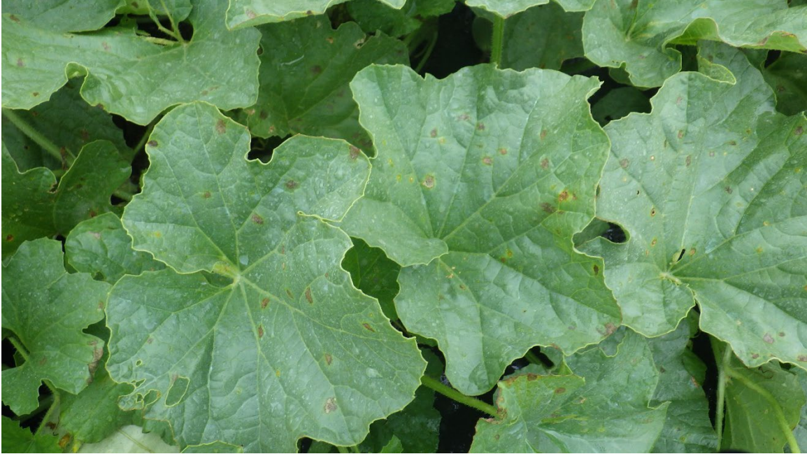
Photo 15 : Taches causées par le mildiou sur le melon brodé, 1 er septembre 2020 En conditions très favorables à la maladie, les taches sont d'abord humides, puis elles jaunissent, brunissent et se nécrosent rapidement.

Lorsque les conditions climatiques sont très favorables à la maladie et que les traitements fongiques sont limités, les lésions brunissent et se nécrosent rapidement.