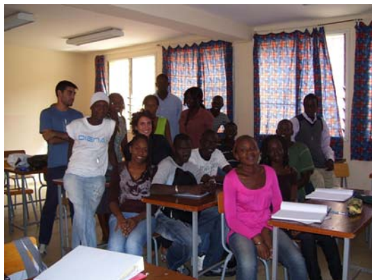
Une classe de l'Institut Sainte Jeanne d'Arc-Post-Bac, Dakar, Sénégal.