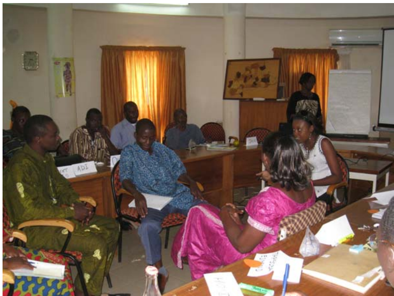
Une équipe de participants pendant un débat.