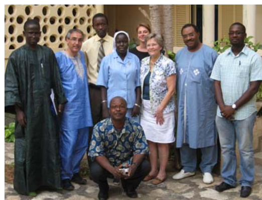
L'équipe de direction de l'Institut Sainte Jeanne d'Arc-Post-Bac, Dakar, Sénégal.