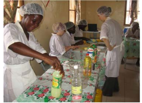
Premier essai de marinade de karité, orange et gingembre.

Et ça continue... Le meilleur de cette histoire est que nous recommençons au mois d'avril prochain en ajoutant à notre séjour, une expérience de contrôle de qualité dans une usine de transformation de jus à partir de fruits africains!