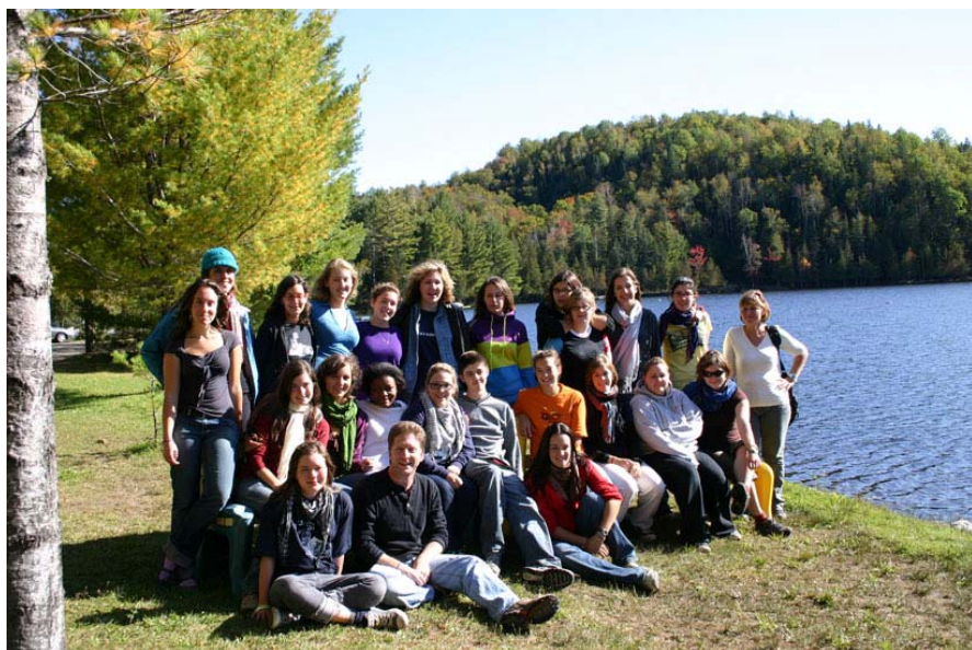
Le groupe de Liaisonneuve 16, lors d'un « 24 heures préparatoire au stage », en septembre 2008.

Les activités de financement prennent une place importante dans les neuf premiers mois du projet. Parce qu'ils ont plus d'expérience de vie, les accompagnateurs aident les étudiants à planifier efficacement ces activités et peuvent les orienter vers des choix plus réalistes. Les accompagnateurs doivent aussi s'assurer que le groupe n'oublie pas l'objectif éducatif du stage, qui va bien au-delà d'un simple voyage touristique ou d'une activité sociale. De plus, la gestion collégiale d'un projet d'une telle ampleur engendre inévitablement des tiraillements au sein du groupe, et il faut aider les étudiants à trouver leurs propres processus de résolution de conflits.