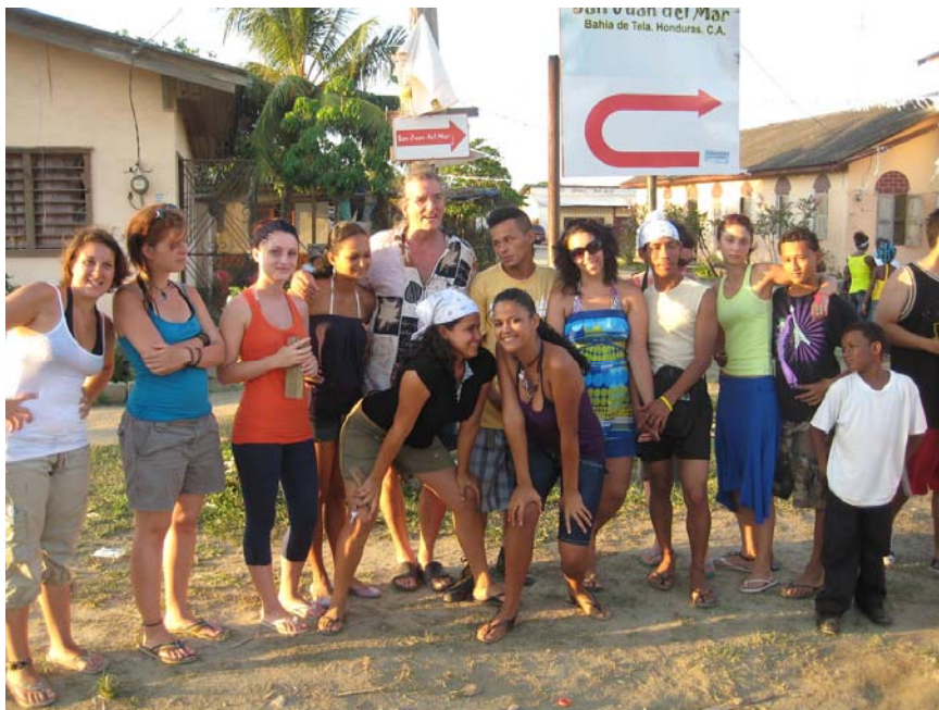
Le groupe d'étudiants québécois accompagnés des jeunes honduriens de la Casa de la Cultura.