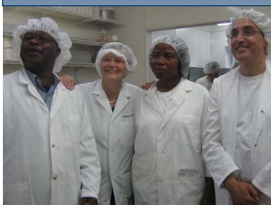
À Laval comme au Sénégal: mêmes mesures de salubrité et sécurité.