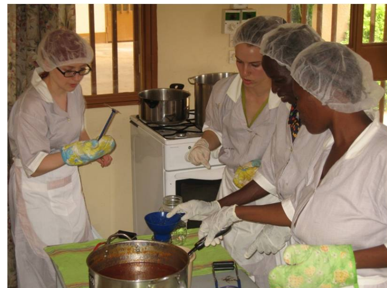
Le bon accord?

Pour réaliser un tel projet, par où commence-t-on? Eh bien, on se retrouve les manches et on commence par se dire : « Mais qu'est-ce que ça goûte, la pulpe de karité? » Et on fait venir par avion, dans un contenant isothermique rempli de blocs réfrigérants, deux kilos de pulpe de karité directement de Ouagadougou pour faire l'essai de nos recettes à Montréal! En goûtant le produit, on découvre avec intérêt que sa saveur possède des ressemblances avec celles de la datte, de la muscade et de l'anis! Ensuite, on fait opérer la magie du développement de recette. Il s'apparente au travail du musicien, qui doit trouver les accords les plus harmonieux afin d'accompagner la mélodie, mais sans la masquer!