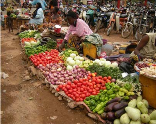
Le marché coloré.

Qu'à cela ne tienne, nous effectuons un deuxième essai, une semaine plus tard, mais cette fois-ci avec des poivrons doux trouvés de peine et de misère. Malheureusement, un nouveau problème se présente : une panne d'électricité généralisée dans tout le quartier! Nous utilisons donc nos méninges déjà bien réchauffées pour changer la procédure et faire la recette sans tous les appareils électriques requis. Et je vous le donne en mille : cette recette fut la meilleure! Quelle belle expérience pour les stagiaires!