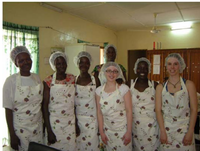
Les étudiantes et des femmes de la coopérative.