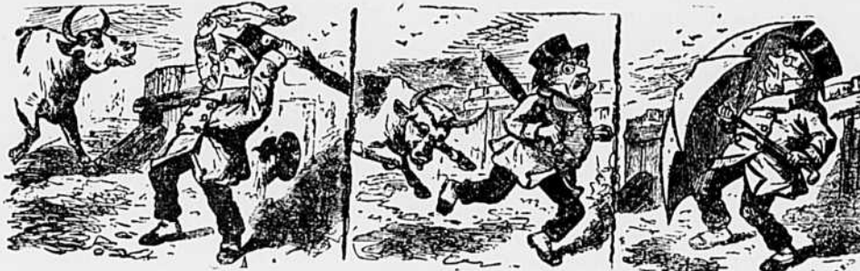
CHAPITRE III.—Aïe !