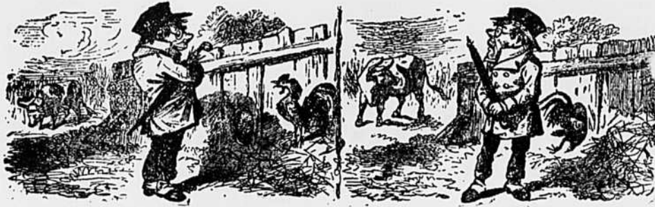
CHAPITRE I.—Ha ! ha !