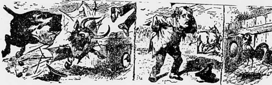
CHAPITRE VI.—Eugh !