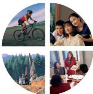
Table | des matières