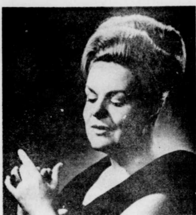
en compagnie du Choeur quelques pièces de son répertoire.