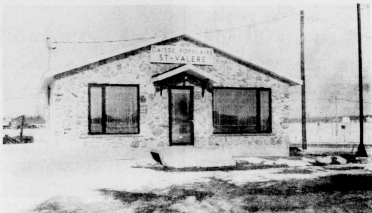
Inauguration du nouvel édifice de la Caisse populaire à Saint-Valère

L'assemblée publique du mois d'avril se tiendra jeudi de cette semaine. Il sera sûrement question une autre fois de toute cette affaire dont les turbulences semblent loin d'être terminées.