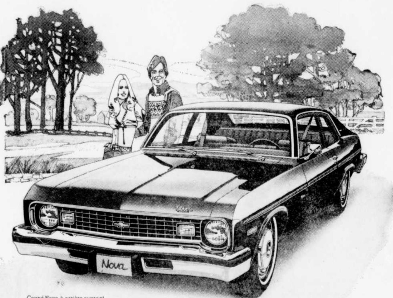
Coupé Nova à arrière ouvrant.

Puisque le monde autour de nous change tellement rapidement de jour en jour, voire d'heure en heure, il est réconfortant de savoir que vous pouvez continuer à compter sur la Nova. D'année en année.