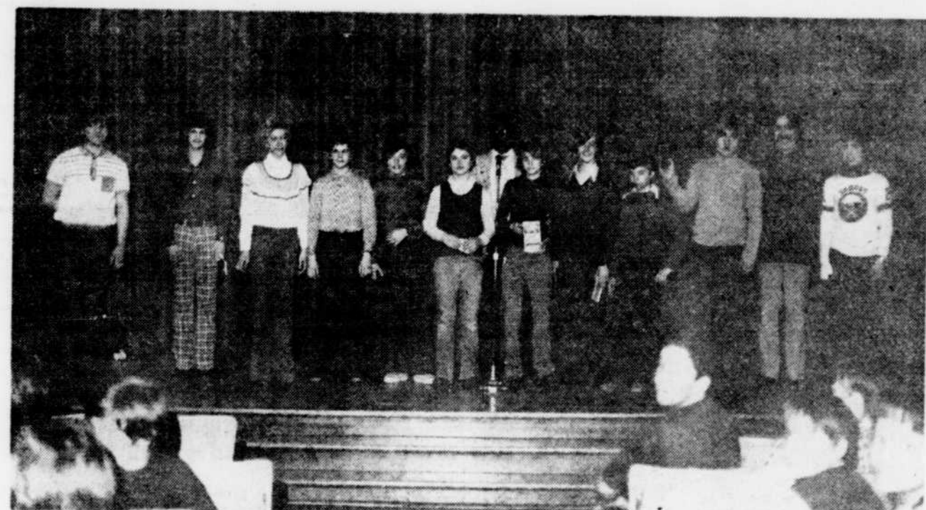
Leçon d'histoire intéressante pour les élèves du secondaire II