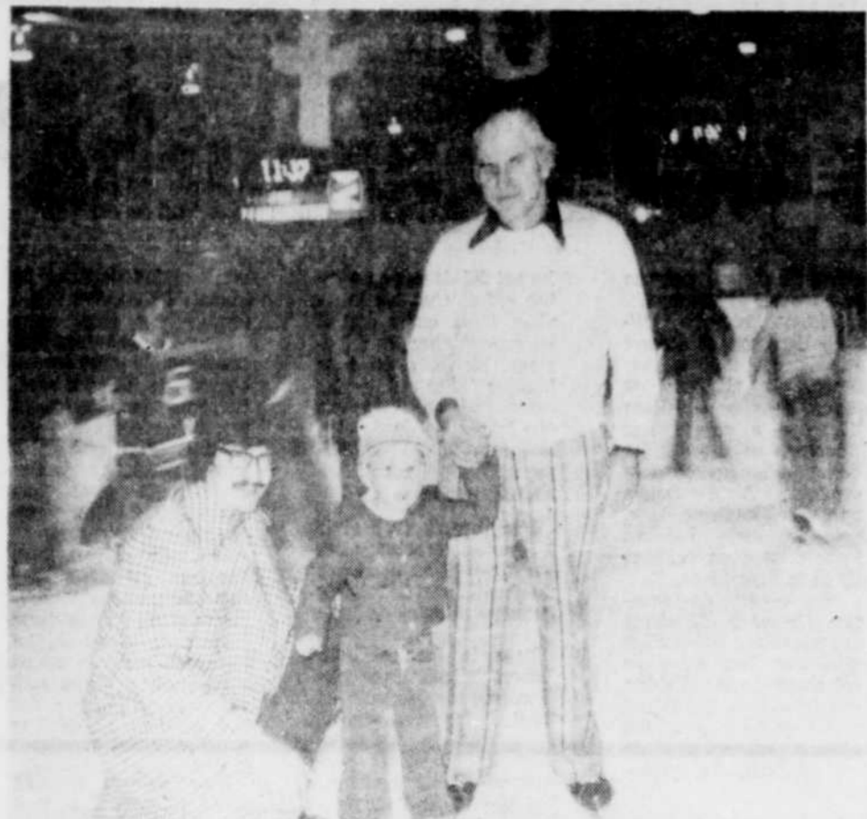
Le patinthon de Warwick, un franc succès...

Un patinthon qui s'est déroulé samedi en l'arène de Warwick au profit du hockey mineur de l'endroit a remporté un franc succès. Comme on le voit sur cette photo, les participants étaient de tous les âges.