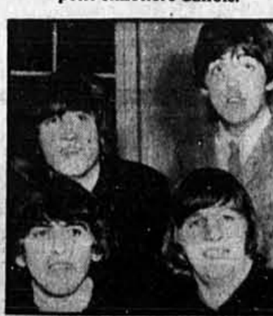
Les Beatles en 1965.