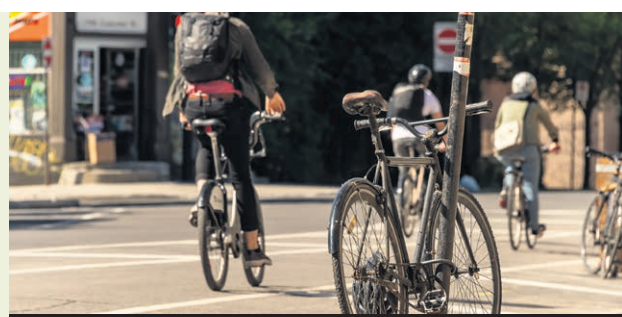
Le transport actif permet également de se maintenir en bonne santé.

S'adressant à la nécessité pressante de reconsidérer nos habitudes de transport face aux défis climatiques, la campagne 2024 de Jour de la Terre Canada, sous le slogan « Le Jour de la Terre, c'est le jour J! », met l'accent sur l'adoption de modes de transport actifs et collectifs.