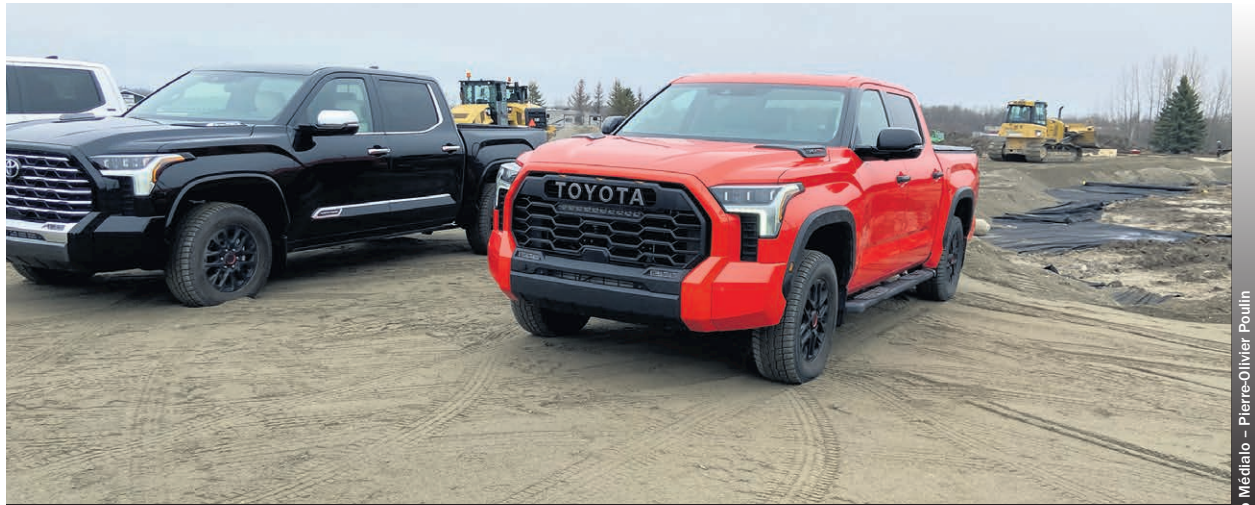
Amos Toyota passera d'un bâtiment de 16 000 à 30 000 pieds carrés.

«Où on était situé avant, c'était problématique un peu, car on n'avait pas le bâtiment pour réaliser la nouvelle image