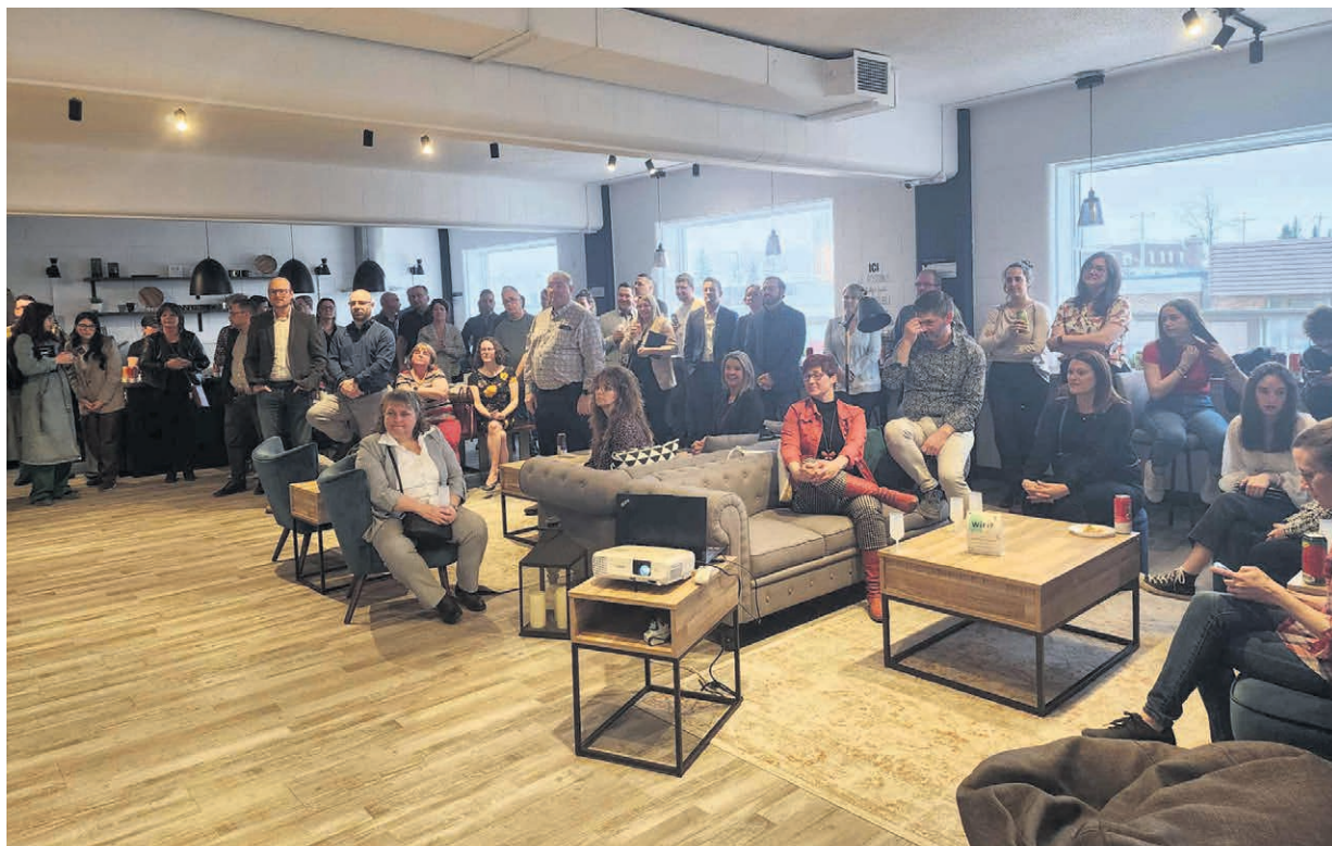
27 entreprises sont confirmées sur la liste des finalistes du 34 e Gala Élites de la CCIAH.

En plus de la Miellerie La Grande Ourse qui avait été l'un des faits saillants de l'édition 2023, le Bureau vétérinaire de l'Abitibi avait conclu la soirée en tant que grand gagnant des festivités.