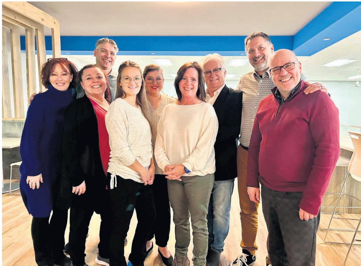
La distribution du spectacle « Clue on stage ».