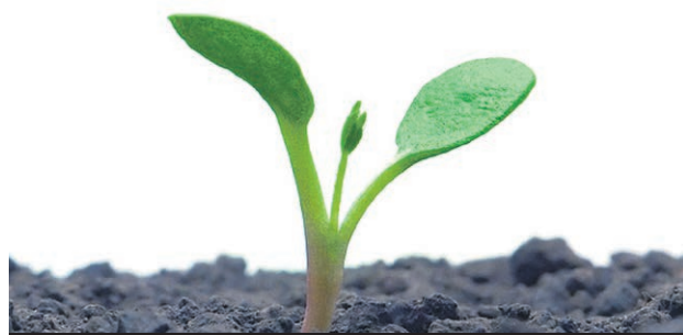
Une marche pour souligner le Jour de la Terre aura lieu le 22 avril prochain à Rouyn-Noranda.

Les citoyens de Rouyn-Noranda et de partout en région sont invités à une grande marche pour souligner le Jour de la Terre et l'importance de protéger l'environnement, le 22 avril prochain.