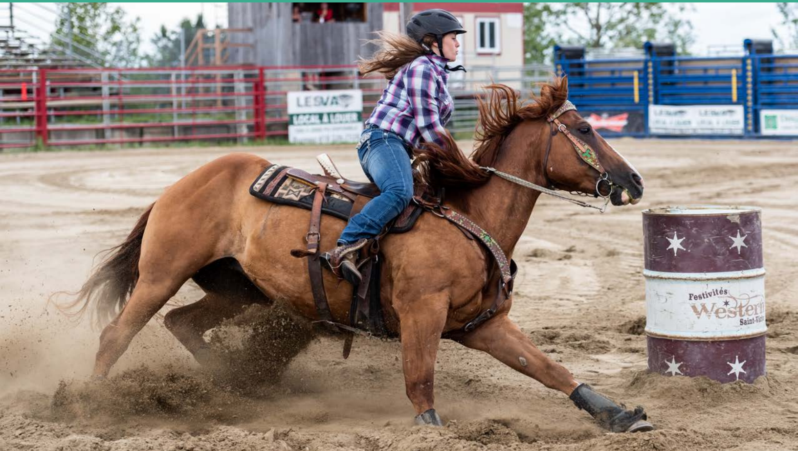
Festivités Western de Saint-Victor | Juillet 2018