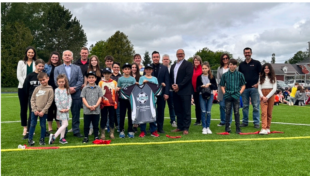
19 juin: Inauguration du terrain synthétique multisport à l'École Le Tremplin.