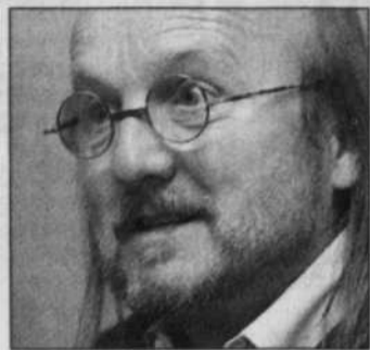
Jim Corcoran