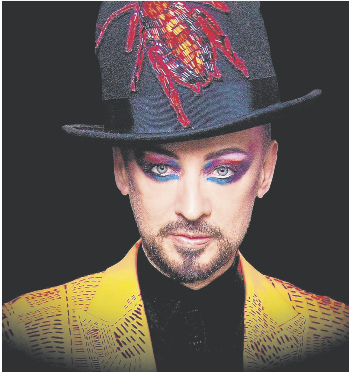
Boy George

soirée du Nouvel An à Québec, il y a neuf ans. J'étais installé dans une cabine faite de glace, ce qui était franchement un peu désastreux, mais la soirée avait été extraordinaire. J'ai fait une tournée des bars par la suite et j'ai adoré. »