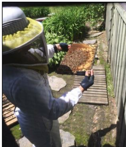
Intermiel, l'apicultrice et ses abeilles