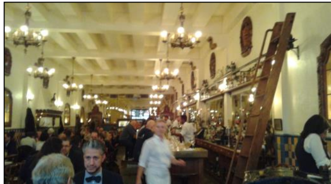
L'intérieur de la Taverne Square Dominion, un des plus beaux resto de Montréal