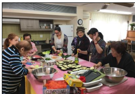
Cuisine collective avec Dépôt alimentaire NDG, HLM Place Lucy