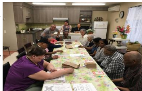
Le plaisir d'être ensemble, même si on ne gagne jamais...Bingo, HLM Place Newman

Un membre du comité nous a confié : “ Je sens que nous sommes une grande famille. Je trouve mon équilibre en participant à tes activités. J'ai reçu le soutien, l'amour lorsque je suis avec vous. J'ai pu bénéficier d'un espace de rencontre et d'échange sécuritaire, harmonieux et stimulant. Sais-tu que j'ai hâte de vous voir à chaque semaine ! Ces activités m'aident, moi et toutes les personnes présentes, à prévenir la dépression, la détérioration physique et mentale. Elles nourrissent notre sentiment d'utilité et de contribution à la société ”.