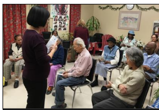
Café-rencontre : Le Centre de bénévolat CDN fait connaître ses services HLM Place Newman