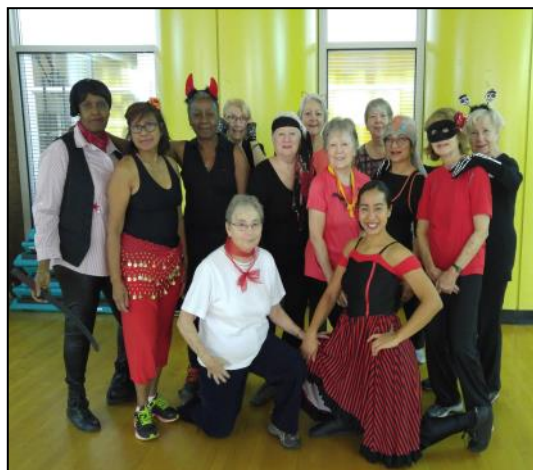
Le groupe de Zumba déguisé pour l'Halloween !