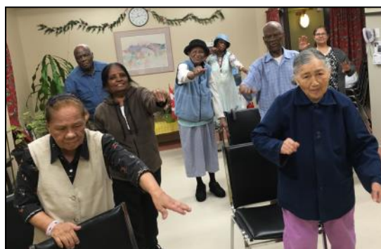
VieActive, HLM Place Newman