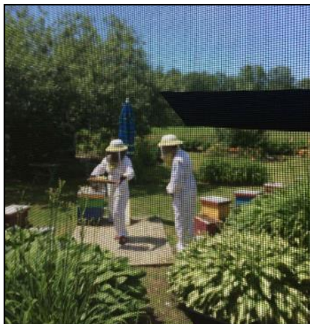
À droite, un membre en combinaison..