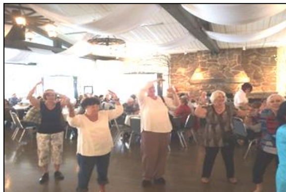
Le rythme de la danse en ligne était au rendez-vous.