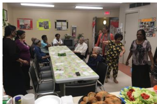
Quelques petites minutes de danse avant le repas, HLM Place Newman

Comme d'habitude (mais cet automne plus souvent), nous avons donné rendez-vous aux résidents dans la salle communautaire des HLMs. Les activités ont toutes procuré un grand plaisir aux participants. On jase, on rit et ça fait du bien de se retrouver. La gentillesse, les beaux sourires et surtout du bonheur ont rempli les belles journées d'activité.