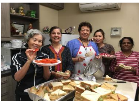
Nous sommes des chefs ! ©Halloween, HLM Place Newman

Alors, vous les aînés des HLMs, venez avec nous. On vous attend !