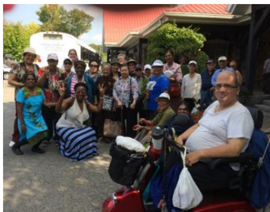
Tout le monde est content et satisfait