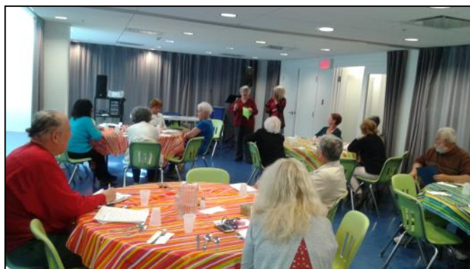
Partage des impressions sur un petit texte de la "Poule joyeuse" de Luigi Malerba.