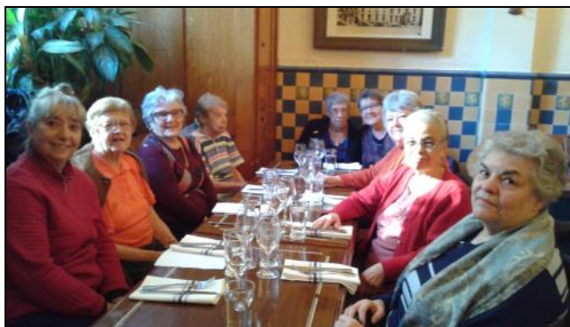
Les participantes de Resto-découvertes autour d'un bon dîner à la Taverne Square Dominion !