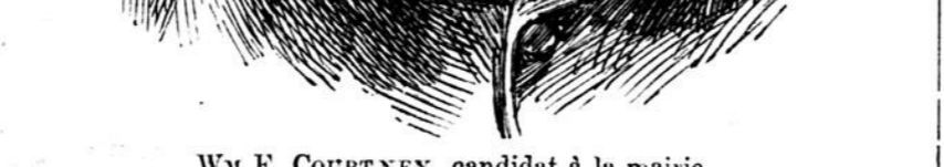
Wm F. COURTNEY, candidat à la mairie.

C'est demain le jour de la votation. Dans vingt-quatre heures d'ici, les citoyens de Lowell auront déposé leurs bulletins et le choix des 33 hommes qui devront gouverner la cité pendant les douze mois à venir sera fait; dans quelques heures les votes seront comptés et mercredi matin, les noms des vainqueurs proclamés.