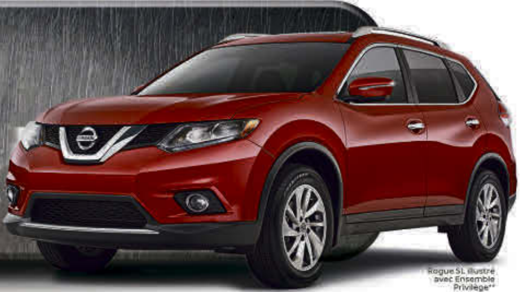
Rogue SL illustré avec Ensemble Privilège**

C'EST COMME PAYER 59$** PAR SEMAINE PENDANT 260 SEMAINES sur le Rogue S 2016 à T.A. 0$ en comptant initial