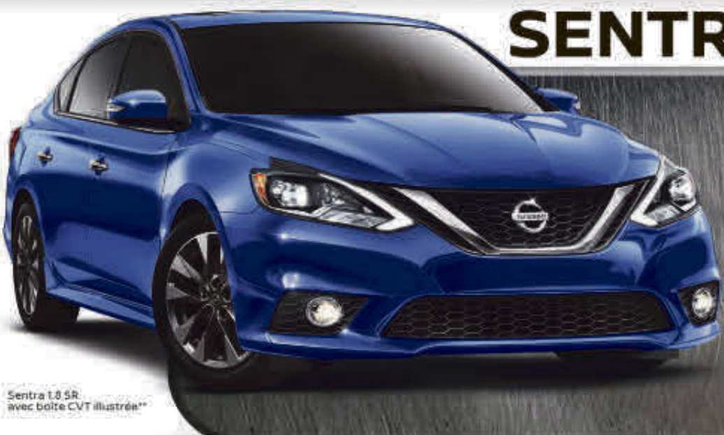
Sentra 1.8 SR avec boîte CVT illustrée**