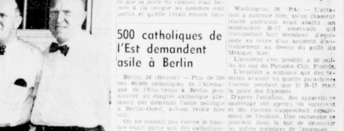
Quand six frères se rencontrent