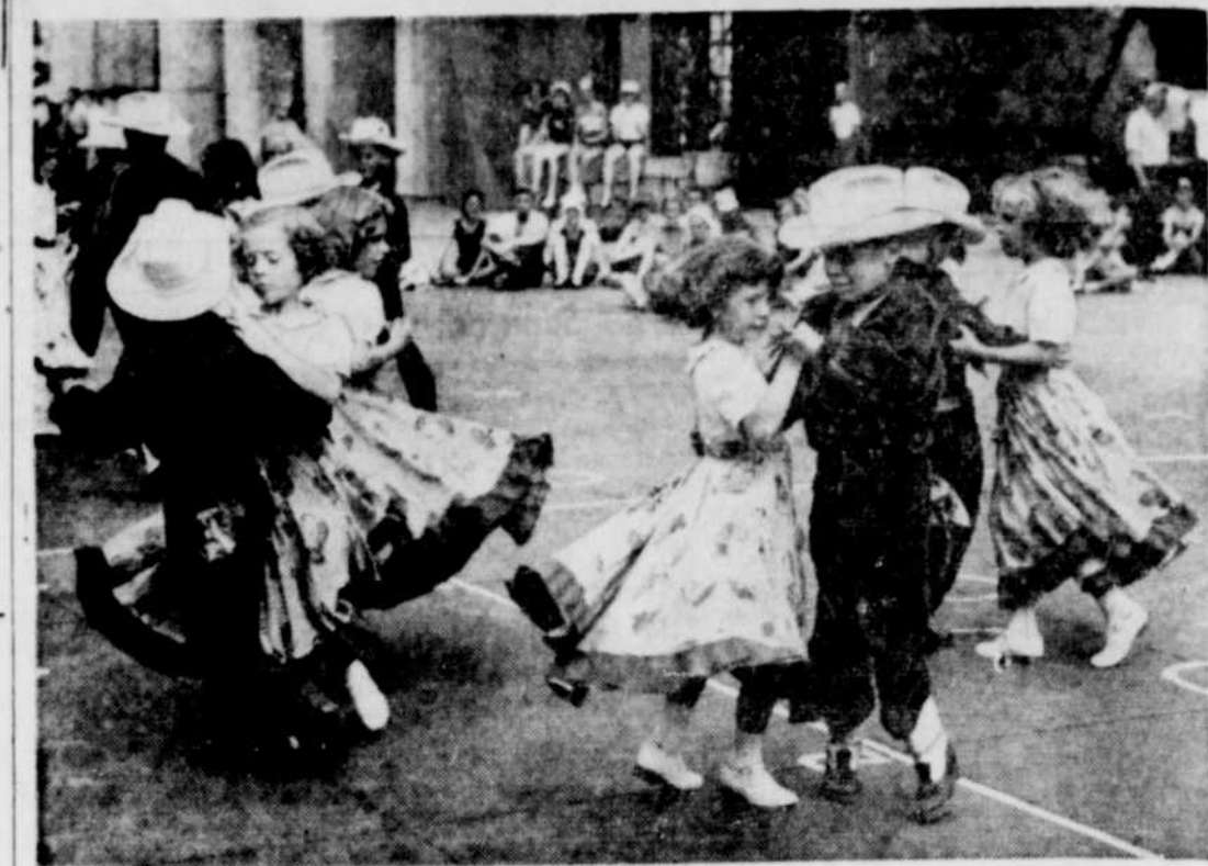
Filliettes en costume anciens et cowboy avec sombrero tournent aux mesures endiablées d'une danse carree au cours d'une fête à Calgary. Agés de 6 à 11 ans, ils viennent du foyer Lacombe à Midnapore, près de Calgary.