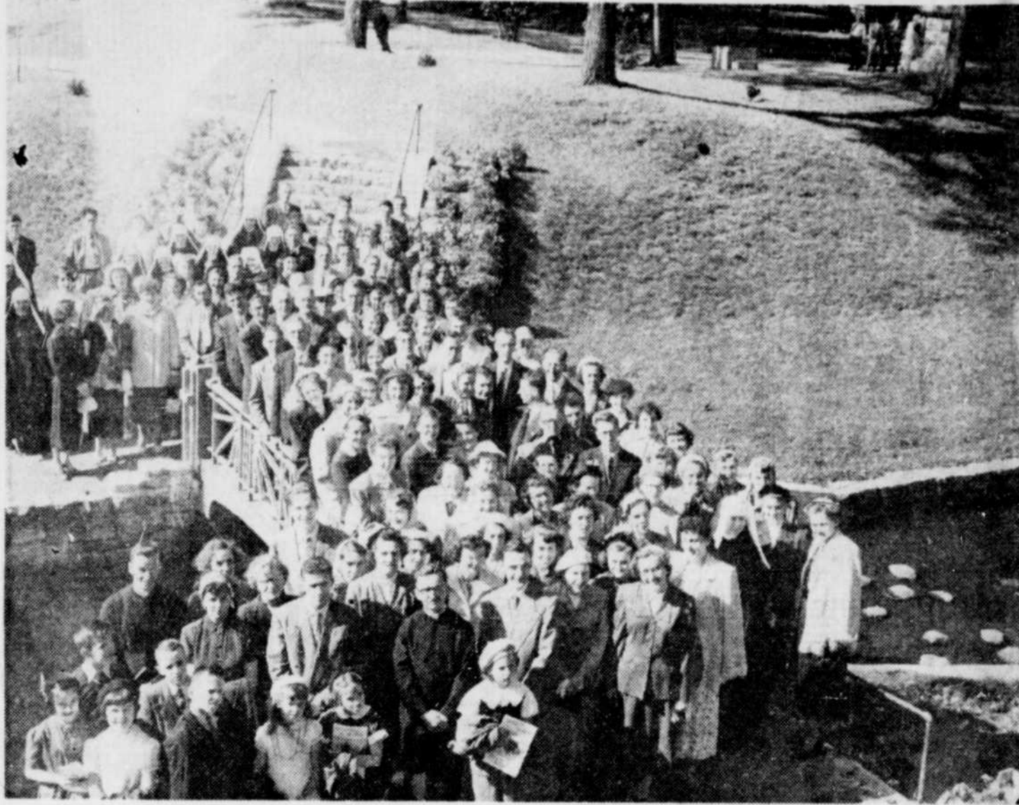
Plus de cent patients du Sanatorium Cooke, de Trois-Rivières ont fait, dimanche dernier, leur pèlerinage au sanctuaire de Notre-Dame du Cap, au Cap-de-la-Madeleine. Cet événement exceptionnel s'est déroulé dans une atmosphère de piété, de joie et de reconnaissance.

Les patients du Sanatorium Cooke au Sanctuaire du Cap