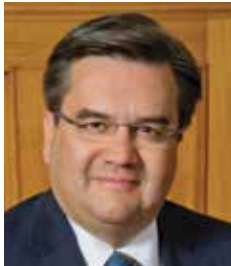
Denis Coderre Maire de Montréal