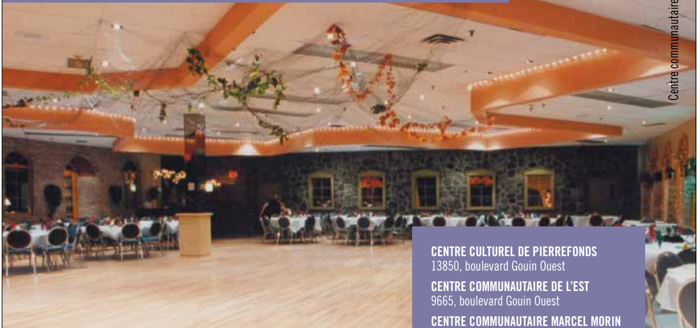
Centre communautaire Marcel Morin

CENTRE CULTUREL DE PIERREFONDS 13850, boulevard Gouin Ouest