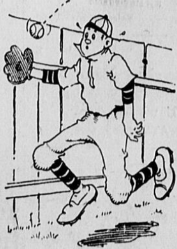
Emery Bousquet; il a bien fait son possible, mais la clôture était là.