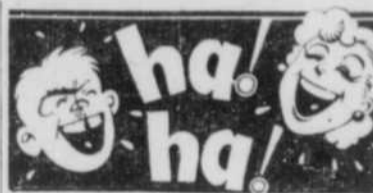
(Les meilleures blagues des programmes de CKAC)