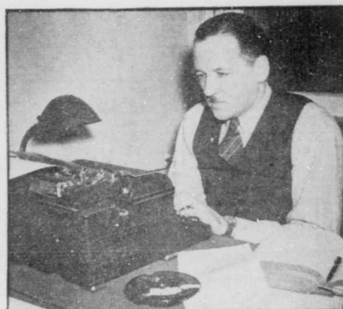
Roger Marien est l'auteur des textes.