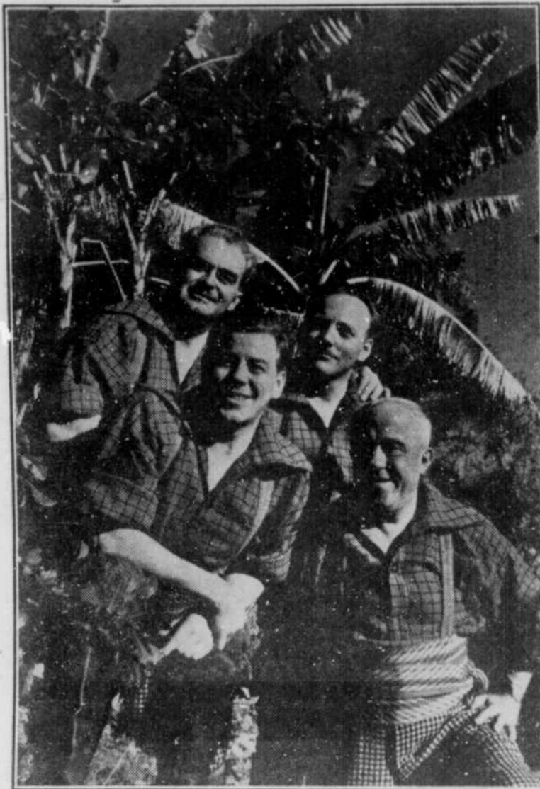
Le QUATUOR ALOUETTE, qui revient d'une tournée au Brésil, sera l'invité au programme "Electric", vendredi soir, le 23 janvier. Ce programme est irradié par le réseau français de Radio-Canada.

Il était question au début de cette chronique du Metropolitan. On vient de décider d'y représenter "Il Tabarro" de Giacomo Puccini. L'oeuvre avait été créée dans cette maison, il y a un quart de siècle, on ne l'a jamais donnée depuis. Dans la production du musicien lucquois, "Il Tabarro" prend place après "Madame Butterfly", créée en 1910. Avant, il y eut "Manon Lescaut", "La Bohème", "La Tosca", "La Fanciulla del West", "La Rondine" et "Trittico". On dit qu'Edward Johnson, directeur général du Metropolitan, est l'un de ceux qui est le plus intéressé à la reprise de l'oeuvre, car il chanta le premier rôle de ténor, lors de la création de "Il Tabarro" à Rome en 1920, sous le nom de Edorado di Giovanni (Edward fils de John). C'était à l'époque où le chanteur du continent nord-américain jugeait bon d'assumer un nom étranger pour se faire engager en Europe. Le Metropolitan n'a pas donné la date de la représentation de "Il Tabarro". Si c'est un samedi, nos radiophiles auront l'occasion d'entendre l'oeuvre. Pour les Américains comme pour les Canadiens, il était de bon ton jadis d'oublier son