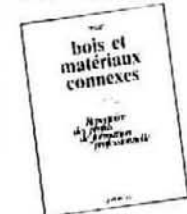
Collection Répertoire des profils de formation professionnelle

Commande postale Les Publications du Québec Case postale 1305 Québec (Québec) G1K 2B5 Vente et information (418) 643-5150 Sans frais 1 800 463-2100 Télécopieur (418) 643-5177