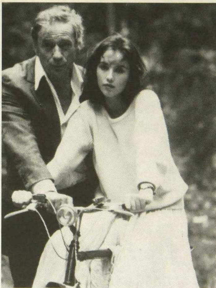
Yves Montand, Isabelle Adjani