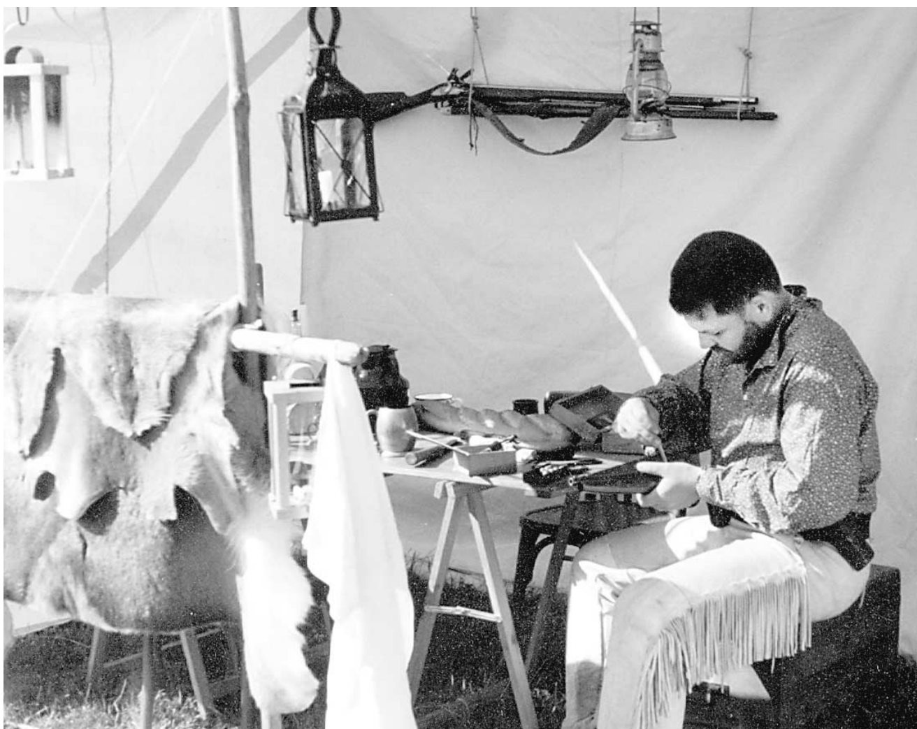
Un des participants au rassemblement des Old Timers.