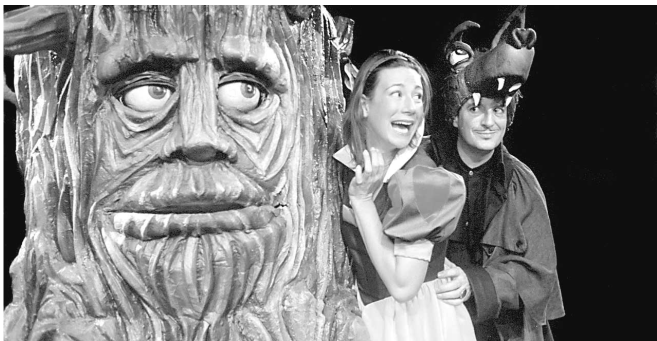
Blanche-Neige aime bien se promener dans les bois pendant que le loup y est.

ZONE INTERDITE IV, au Studio Juste pour rire, jusqu'au 28 juillet, à 23h.