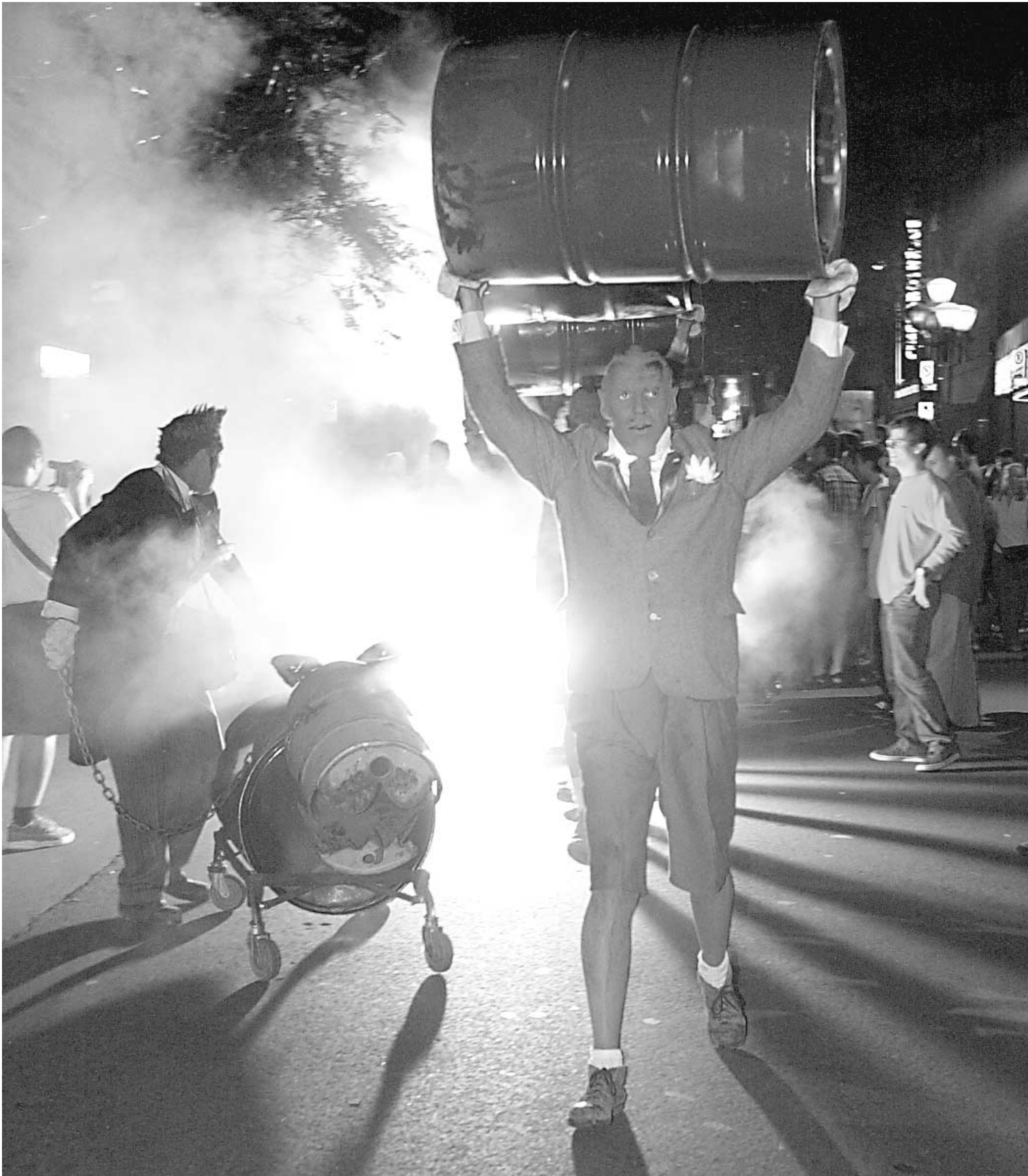
Générrik Vapeur : barbare et envoûtant.