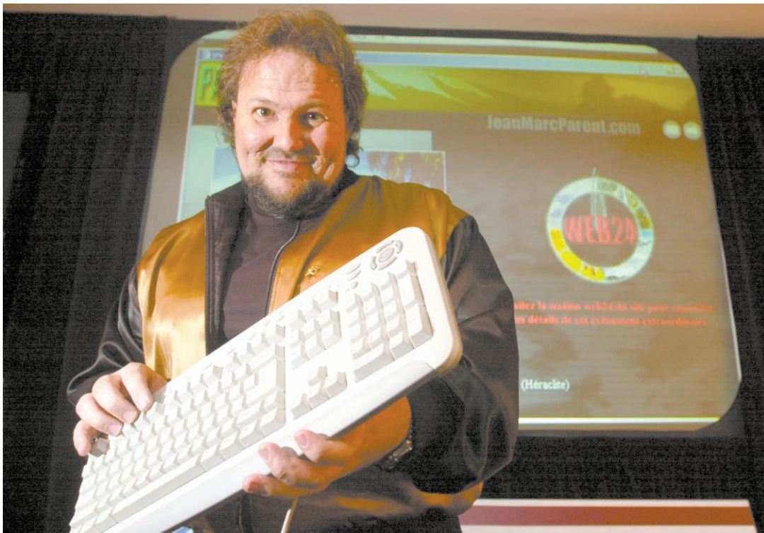
Le marathon de l'humoriste Jean-Marc Parent, qui essaiera de créer le record du plus long spectacle d'humour, commence demain sur le Web.

VOUS PLANIFIEZ un petit voyage aux États-Unis et vous songez à visiter un ou des parcs nationaux, mais vous n'arrivez pas à choisir? Le service de vente de vêtements par correspondance L.L.Bean peut vous venir en aide grâce à son service L.L.Bean's Park Search disponible à partir de son site Web ( www.llbean.com/parksearch ). Une fois sur place, vous trouverez une banque de renseignements au sujet des parcs, forêts et autres lieux de villégiature américains. Pour accéder à l'info, entrez simplement le nom du parc ou le nom de la région et le site vous