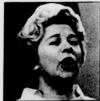
CLAIRETTE sera invitée à «Place aux femmes», LUNDI à 10 h 00.