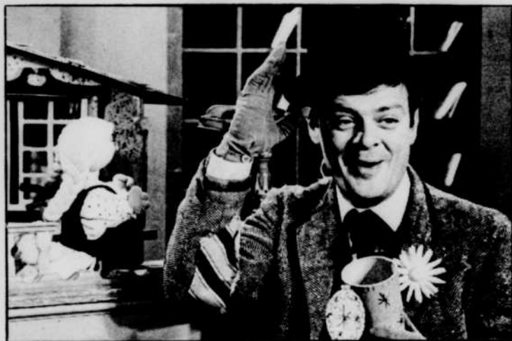
Bobino, du lundi au vendredi à 16 heures