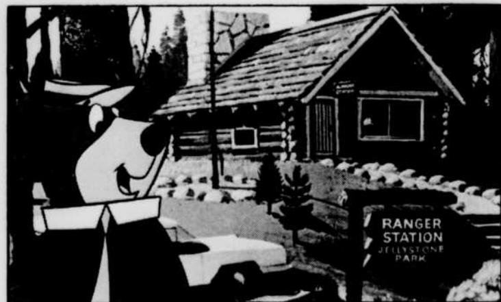
Yogi, le vendredi à 17 heures

9 h 10—CBOFT—COURS SCOLAIRES «Sciences naturelles»: les mammifères.