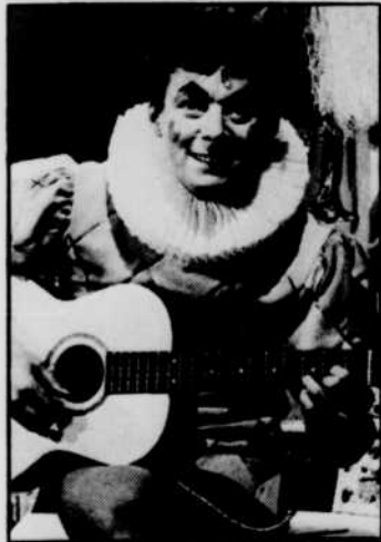
Monsieur Surprise, du lundi au vendredi à 10 h 45 et à 17 heures le lundi.