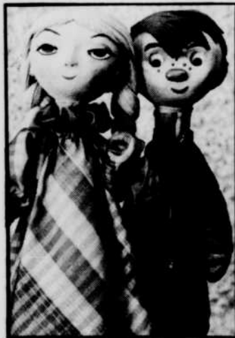
Pépinot, le samedi à 10 h 30