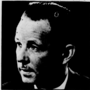
Le docteur Armand FRAPPIER