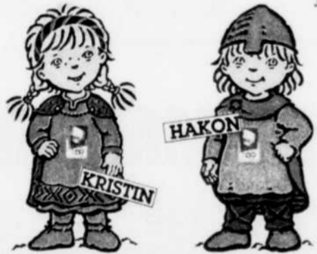
Les mascottes des Jeux olympiques de Lillehammer