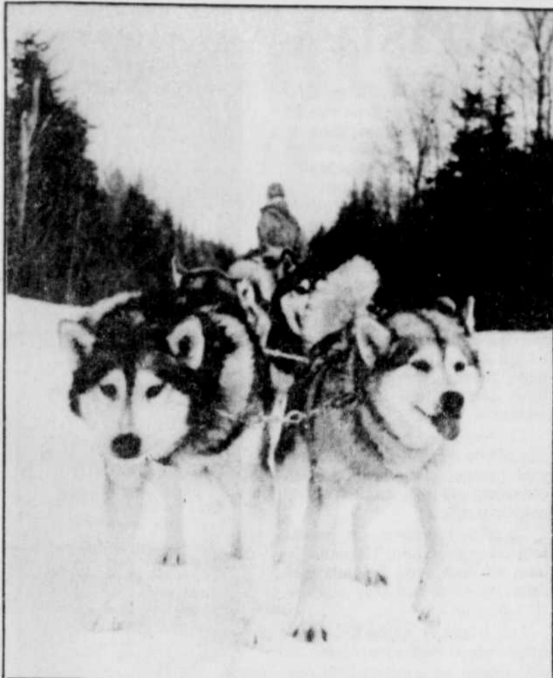
Il y aurait moyen de se perdre dans le lacs des pistes si le conducteur de l'attelage n'y allait pas à l'occasion d'un « dji » pour envoyer le chien meneur à droite ou « ya » à gauche.