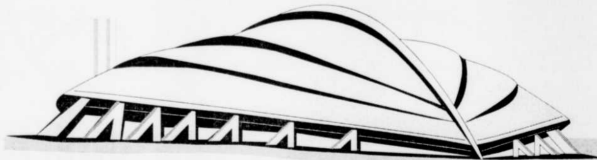
C'est dans ce centre sportif que se dérouleront les compétitions de patinage artistique et de vitesse. Il a une capacité de 8000 spectateurs et après les Olympiques il pourra contenir de 10 000 à 20 000 personnes. Situé le long du lac Mjosa, ce centre ultramoderne ressemble à un bateau viking renversé (drakkar).