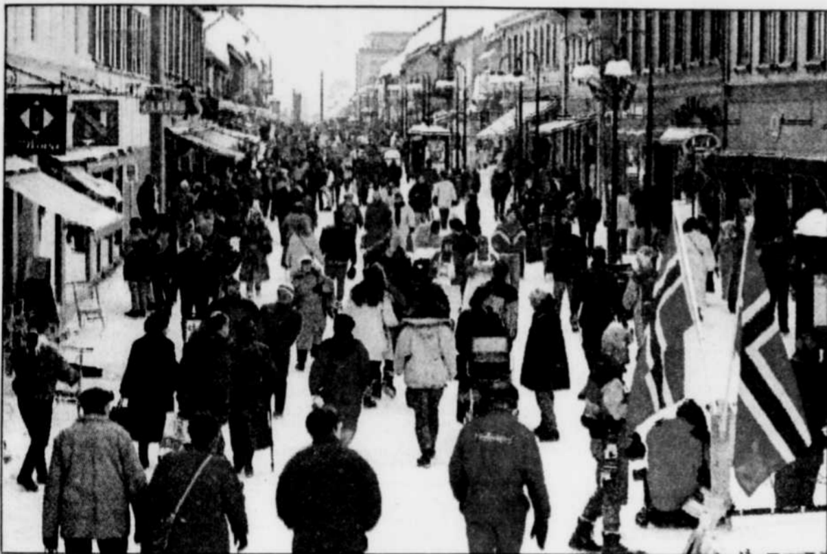
« Storgata », la principale zone piétonnière de Lillehammer est noire de visiteurs. Cette ville qui compte habituellement une population de 23 000 habitants doit accueillir plus de 100 000 visiteurs par jour pendant les Olympiques.

LILLEHAMMER, Norvège — Un jet de lumière oblique émerge paresseusement au-dessus de l'horizon, juste au moment où le soleil se mire sur Lillehammer et le lit gelé du lac Mjosa.