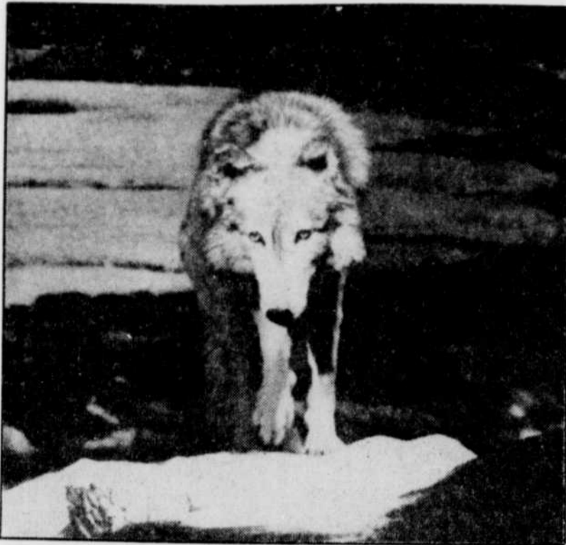
Des milliers de touristes se rendent au parc Algonquin, en Ontario, dans l'espoir d'entendre le hurlement du loup.

Les hommes n'ont heureusement plus la même perception de cet animal qui, aujourd'hui, est souvent considéré comme un ami plutôt que comme un ennemi de l'homme. Le film Il danse avec les loups en est un parfait exemple.