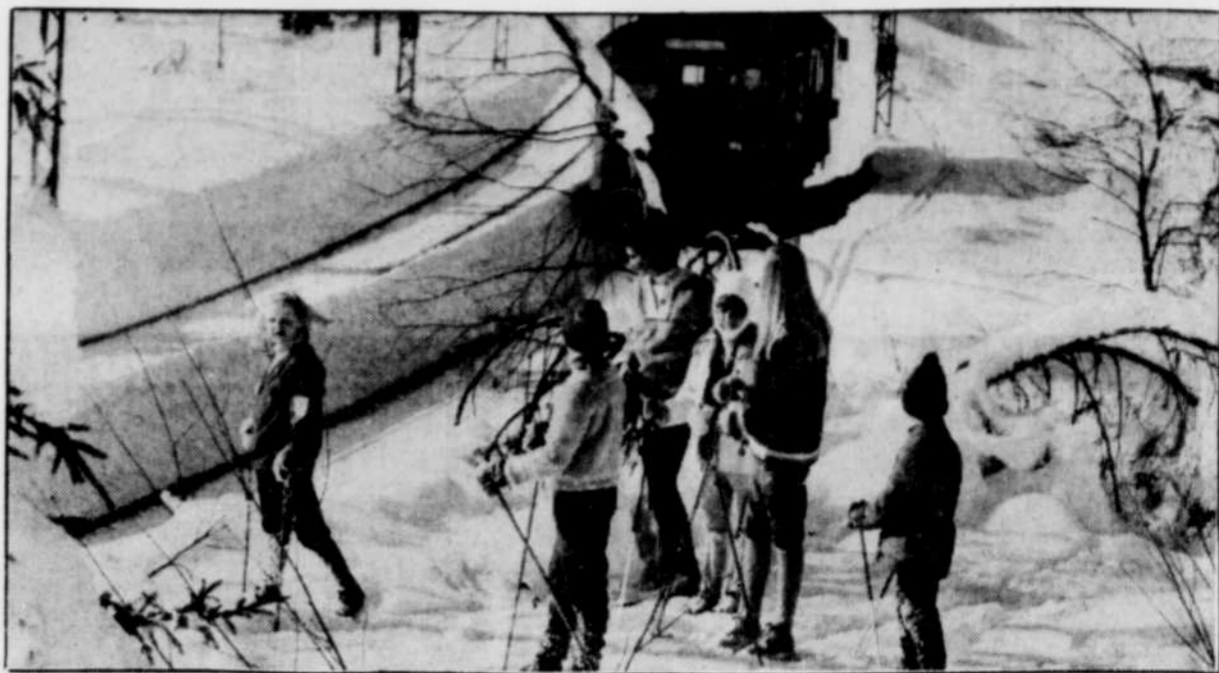
La région de Lillehammer offre 480 kilomètres de pistes de ski de fond entretenues.

Quant à la bouffe, disons tout de suite que la cuisine norvégienne n'est pas automatiquement synonyme de haute gastronomie, à moins bien sûr que vous raffoliez de langues de rennes ou de poisson mariné... Les prix auront aussi de quoi surprendre : un sim-