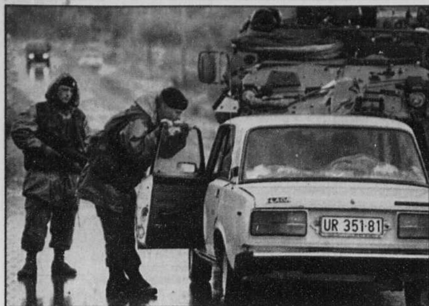
La KFOR avait mis en place un important dispositif de sécurité hier pour l'inhumation prévue des 14 paysans tués vendredi soir à Gracko. Des soldats canadiens (notre photo) contrôlaient notamment les allées et venues vers Gracko.