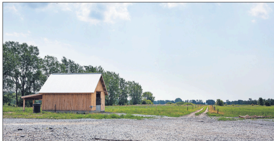
Près de l'étable, ce petit bâtiment a aussi été érigé. Il abrite les eaux usées de la ferme. Quant à l'appentis aménagé, il servira au futur parc des génisses.