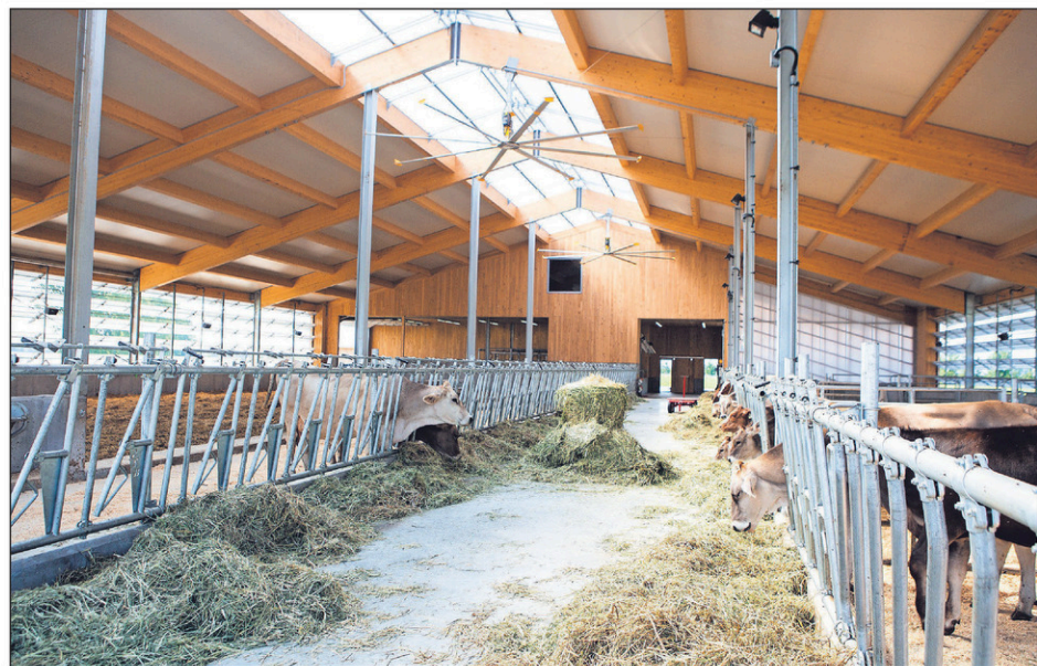
Les vaches qui produisent du lait sont séparées des autres par une large allée centrale.

Par grande chaleur, elles rentrent parfois quelques heures. D'ailleurs, la quasi-totalité du troupeau profitait du soleil au pâturage lors du passage du Canada Français . «L'étable est bâtie pour l'hiver», précise Marie-Pier Gosselin.