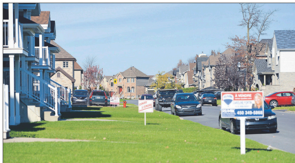
Un total de 457 transactions immobilières a été conclu d'avril à juin 2019 sur le territoire johannais, une hausse de 15 % par rapport au deuxième trimestre de 2018.

Tous secteurs confondus, le prix médian pour les résidences unifamiliales à Saint-Jean-sur-Richelieu s'est chiffré