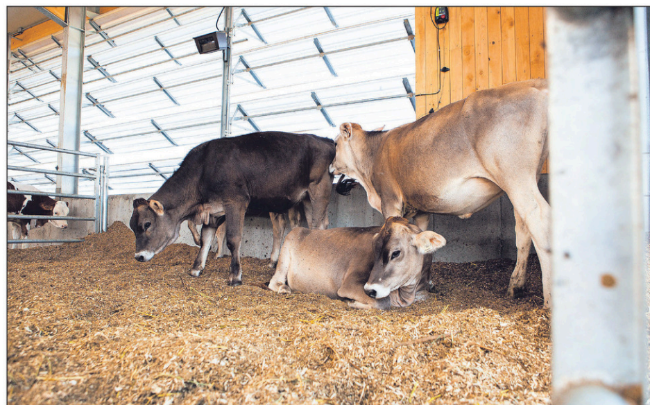
Les veaux ont maintenant un espace dédié et vivent avec une nourrice.