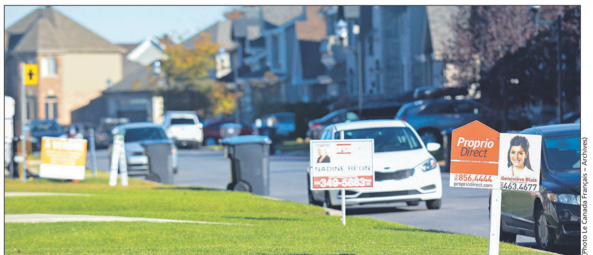
Pour une maison existante, un incitatif de 5% sera offert, tandis qu'il sera de 10% pour une construction neuve.

«Les mesures que nous proposons réduiront les mensualités hypothécaires par une marge pouvant atteindre 286 $. Les Canadiens auront donc davantage d'argent à dépenser, et nous estimons que cet incitatif bénéficiera à 100 000 familles», a souligné Jean-Yves Duclos, ministre de la Famille, des Enfants et du Développement social et ministre responsable de la SCHL.