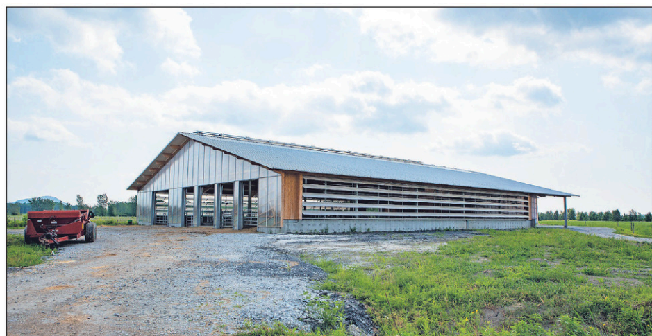
L'étable a été positionnée sur le terrain afin de profiter des vents dominants.