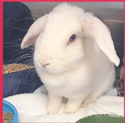
Trois-Rivières Nani, lapin Femelle, âge inconnu