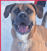
Trois-Rivières D.J., Boxer croisé Mâle, 5 ans