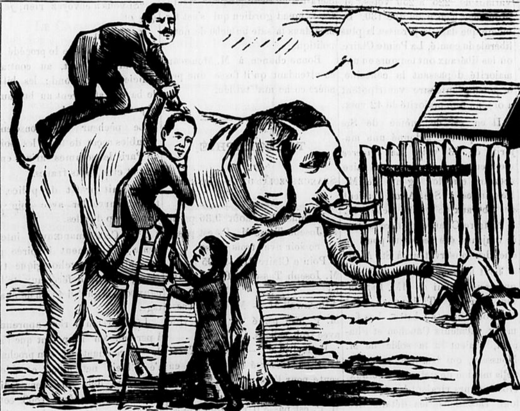
JUMBO A QUÉBEC.

CHAPLEAU.—Ne craignez rien messieurs, vous pouvez grimper dessus sans danger. Je l'ai apprivoisé moi-même.