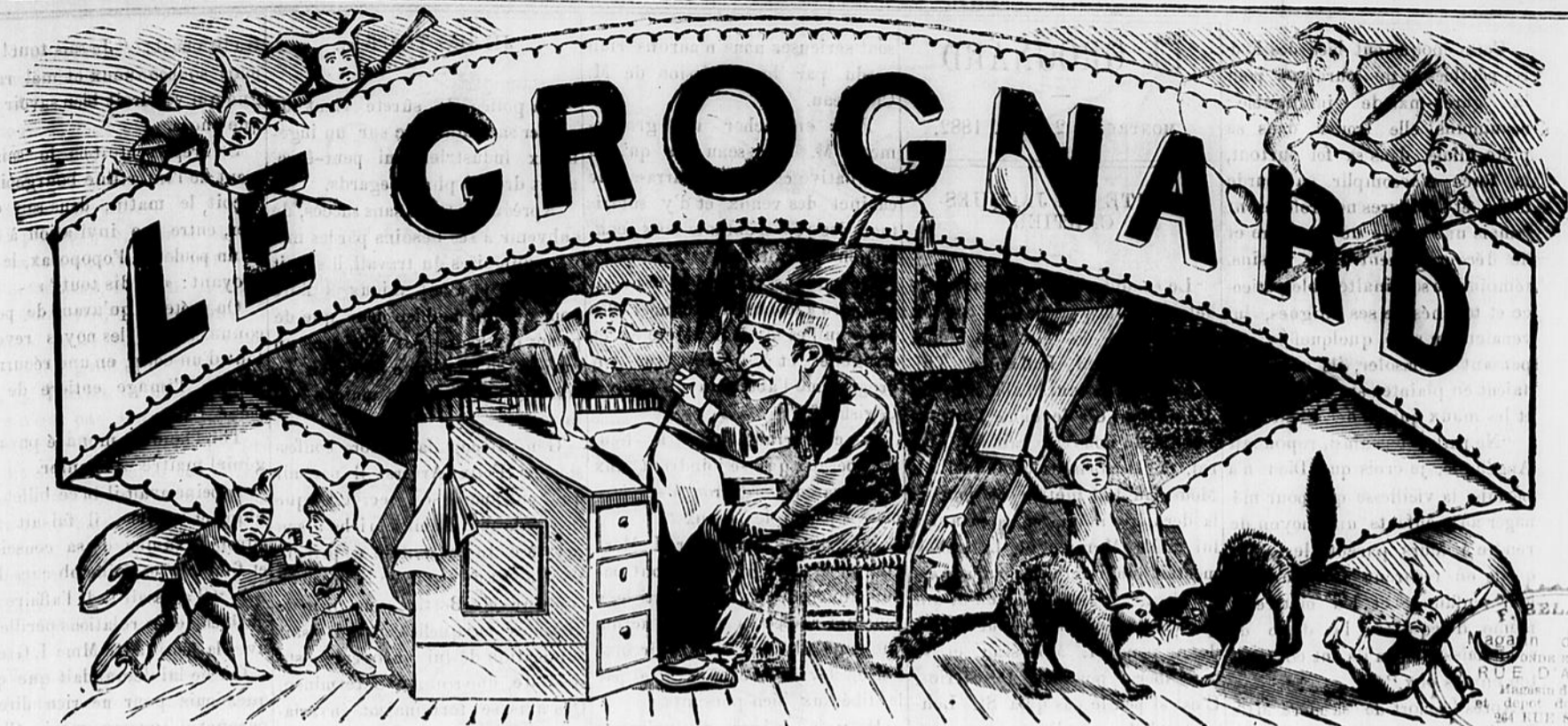
(Ci-devant "LE VRAI CANARD")