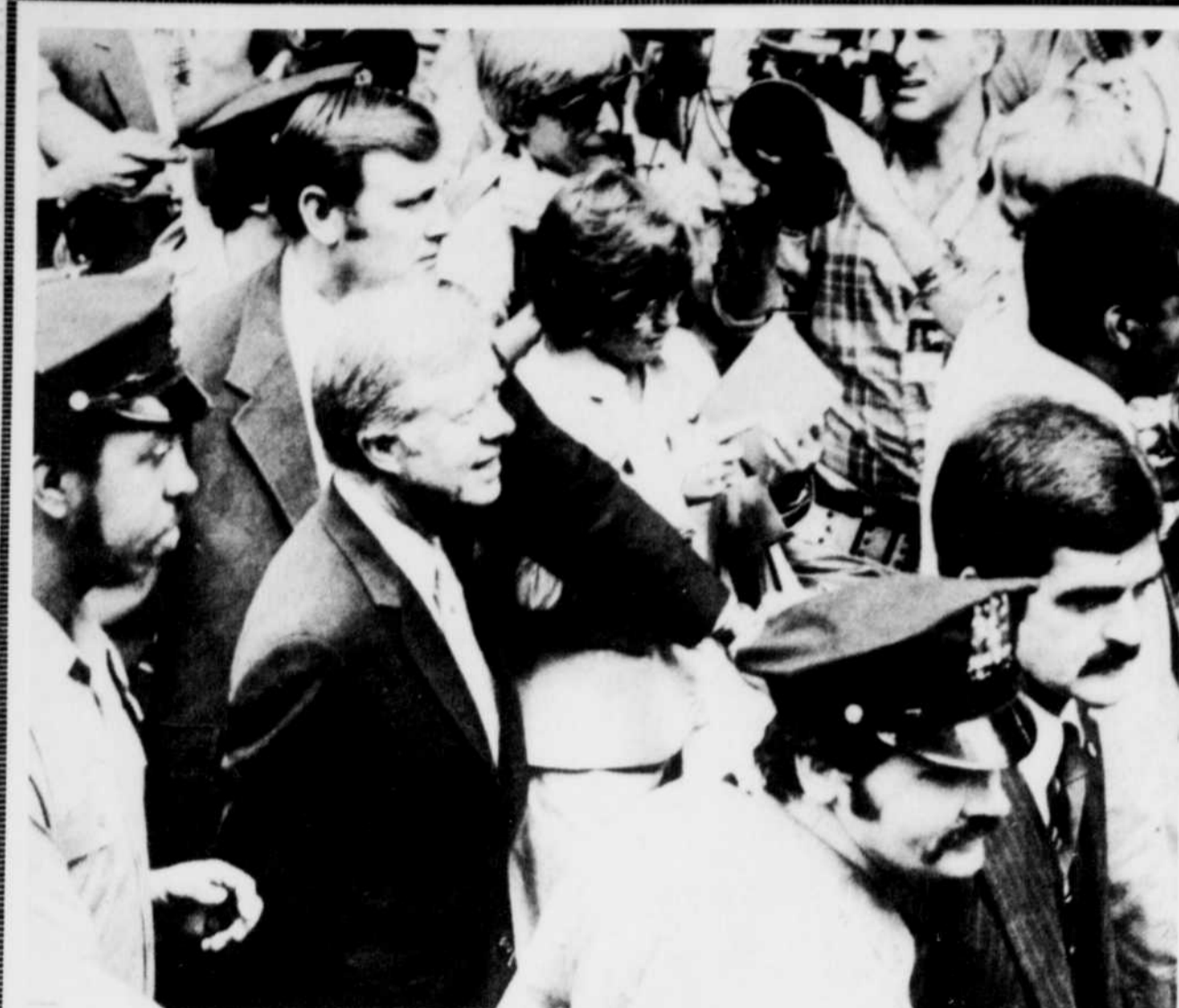
Le président Carter est entouré par des gardes de sécurité lors de son arrivée hier à la convention démocrate à New York.