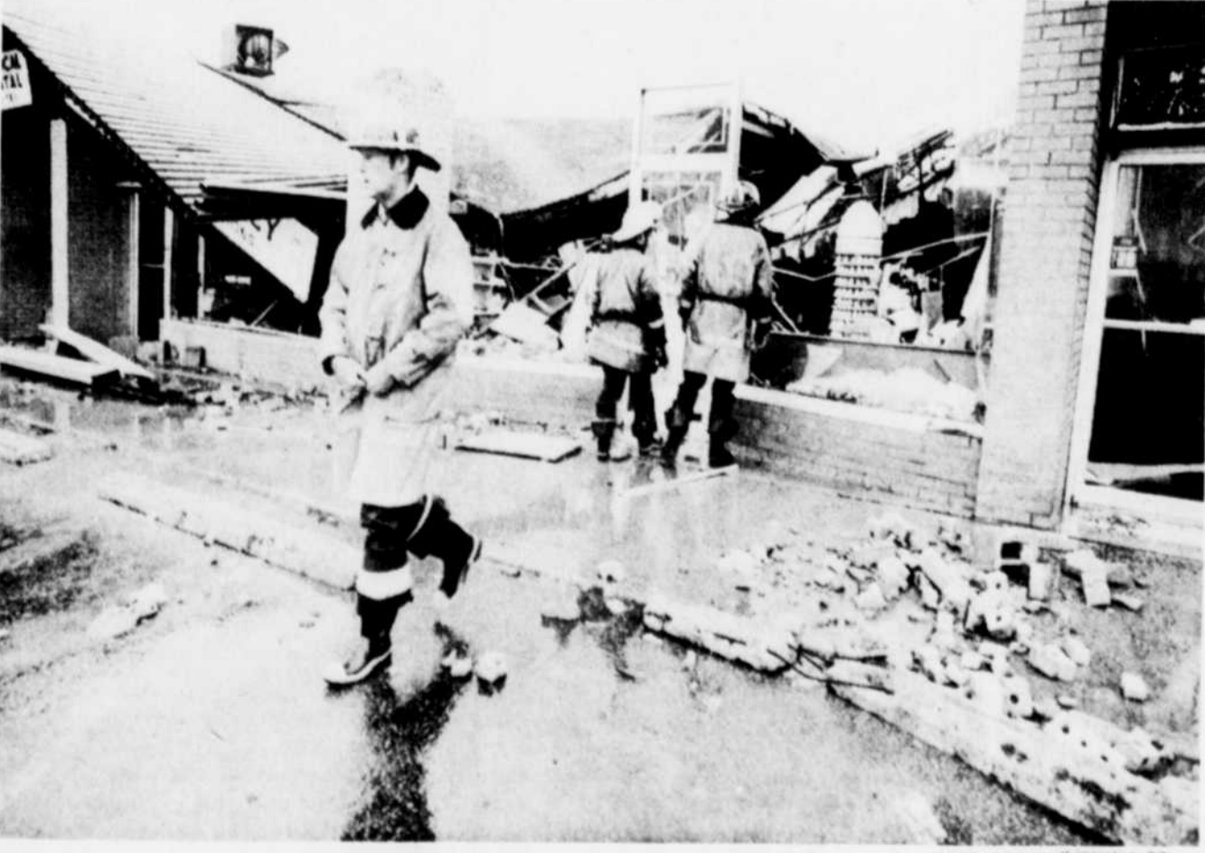
Un quartier du sud-est de London, en Ontario, a été visité hier par une mini-tornade qui n'a duré que quelques instants. Des magasins de Glenn Cairn ont été ravagés par les vents violents mais on ne déplore pas de victimes.