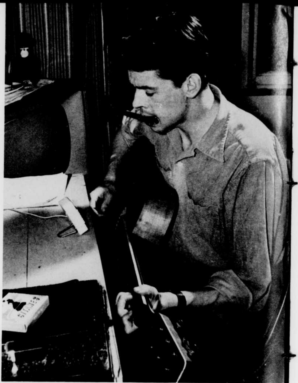
Devant son cadran-chronomètre, le troubadour Jacques Brel minute avec précision sa toute dernière chanson. Il est, bien entendu, un troubadour très moderne.

Enfin, pour Jacques Brel: « L'intelligence part du coeur... j'essaie de défendre le coeur. »