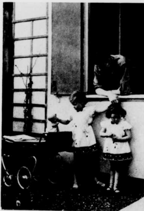
Un troubadour moderne qui retrouve parfois le rythme plus lent des joies familiales. Les exigences de ses enfants sont les siennes: il faut grimper!