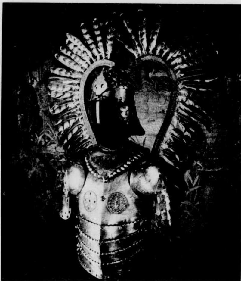
Armure royale du XVII e siècle

Grâce au Service international de Radio-Canada et à la collaboration de