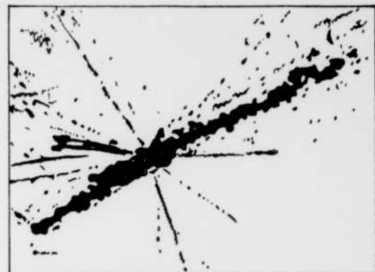
Noyau de fer du rayonnement cosmique désintégré.

Enfin, il nous parlera de la fission des atomes et des rayons terrestres et cosmiques, en nous faisant part des travaux de collaborateurs canadiens et étrangers.