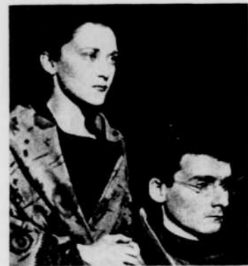
MARIA CASARÈS et MICHEL BOUQUET lors de la création des Justes, au Théâtre Hébertot, en 1949.

Seulement, tandis que Sartre donne la primauté à l'idée et à l'action révolutionnaires, Camus apporte