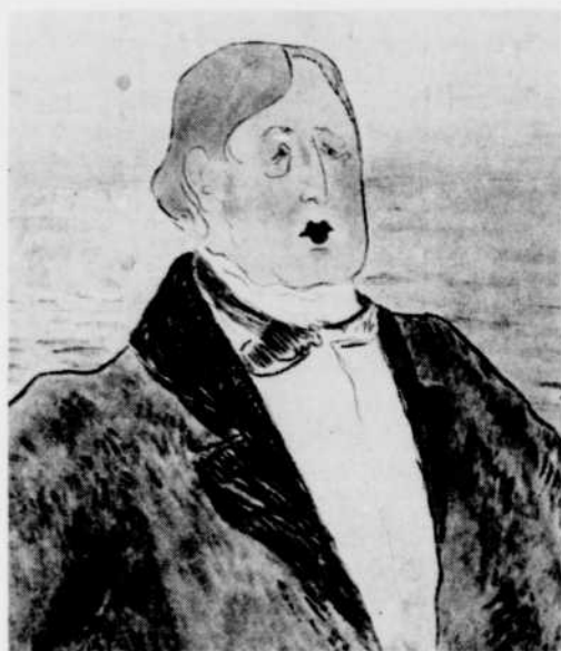
Portrait d'Oscar Wilde par Toulouse-Lautrec

Une scène savoureuse, où est dépeint avec esprit le ridicule d'un attachement outré à des convenances vidées du moindre contenu humain, nous fait connaître le père d'Arthur, lord Anthony Savile, vieil aristocrate anglais qui ne jure que par la ponctualité au petit déjeuner quotidien. « Entre trois et 75 ans, un Savile n'est pas absent au breakfast , sans excuse valable... Quand un homme commence par renoncer à son petit déjeuner, on ne sait plus où il s'arrêtera », confiera-t-il