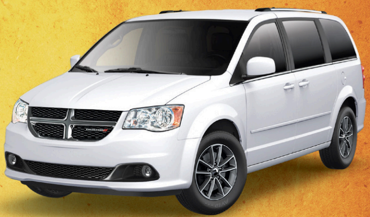
Prix de départ du modèle Dodge Grand Caravan SXT Premium Plus 2016 montré, incluant une remise au comptant de 7 000 $* et un boni de 1 500 $* : 31 085 $**

À PARTIR DE : 23 695 $ ± ET 0 % ± JUSQU'À 84 MOIS ET AUCUN ACOMPTÉ LE PRIX INCLUT 5 500 $* DE REMISE AU COMPTANT, LES FRAIS DE TRANSPORT ET LES FRAIS SUR LE CLIMATISEUR.