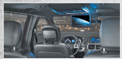
+ Console DVD de 9 pouces au pavillon à la 2 e rangée