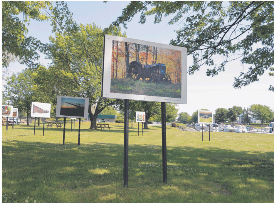
Les photos sont exposées au 1, 61 e avenue, à Saint-Paul-de-l'Île-aux-Noix.

L'an dernier, le thème de la première édition du concours était Notre rivière Richelieu . La municipalité avait reçu 151 photos de 21 photographes.