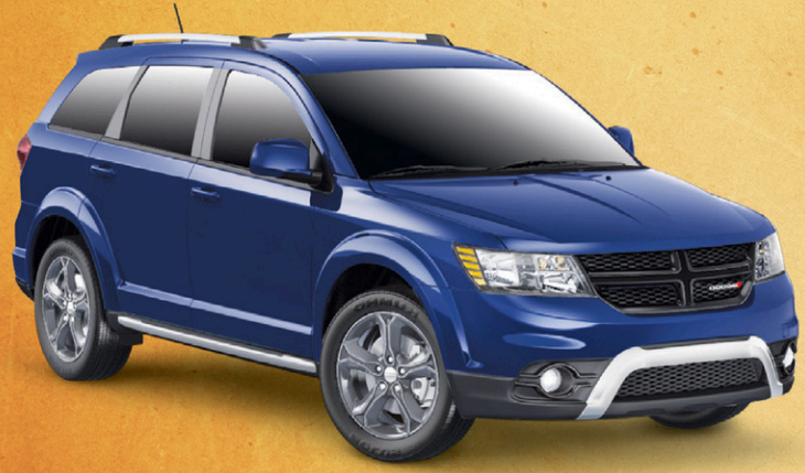
Prix de départ du modèle Dodge Journey Crossroad 4X2 2016 montré, incluant une remise au comptant de 1 000 $* et un boni de 1 500 $* : 32 690 $**