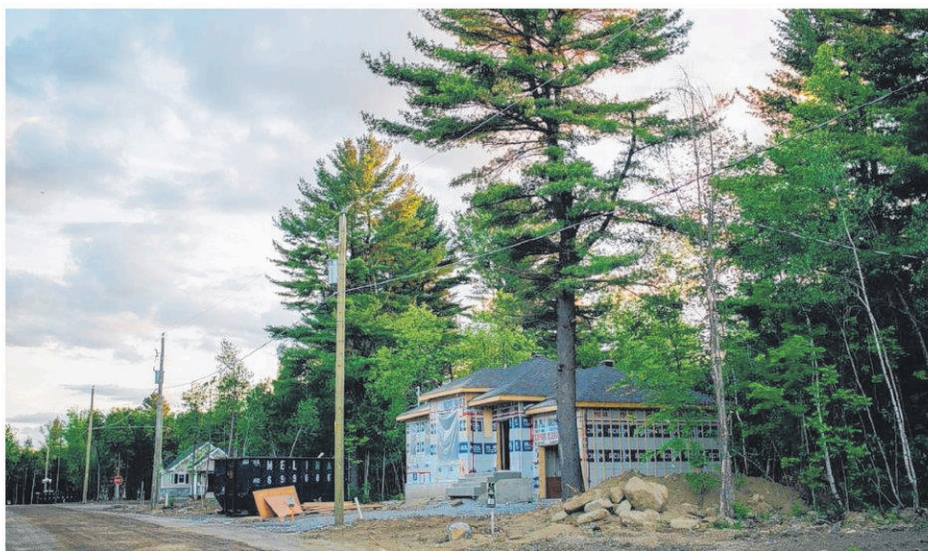
Le promoteur a conservé une zone tampon boisée d'environ 20 pieds entre les terrains, ce qui donne un cachet particulier au quartier.

font partie de ces jeunes familles qui ont choisi de s'établir dans la municipalité avec leurs enfants de 4 et 7 ans.