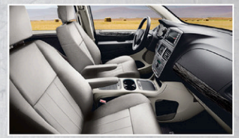
+ Intérieur haut de gamme