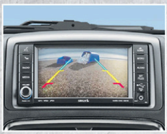
+ Caméra de recul ParkView MD