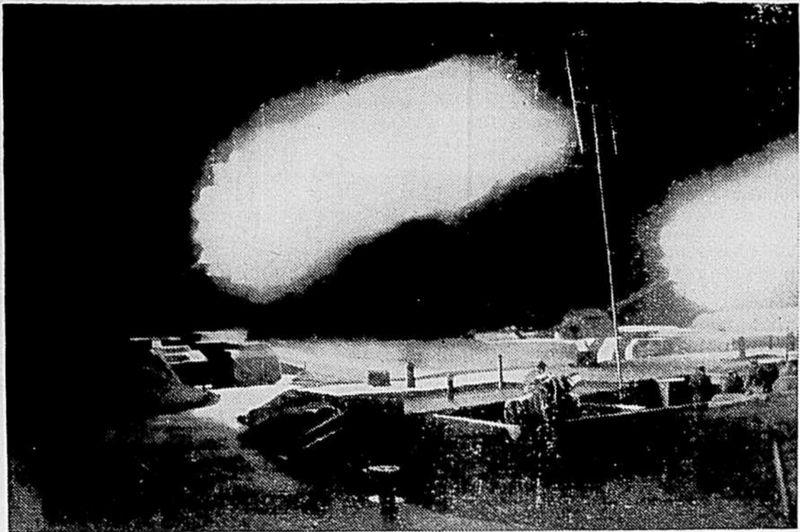
Les canons de Londres dressèrent un terrifiant barrage lorsque des raiders allemands tentèrent de "libérer" la capitale en février 1944. Cette saisissante photo fut prise par un artiste du "Times". On y voit une batterie antiaérienne à l'action dans la banlieue de Londres, au cours d'un raid.