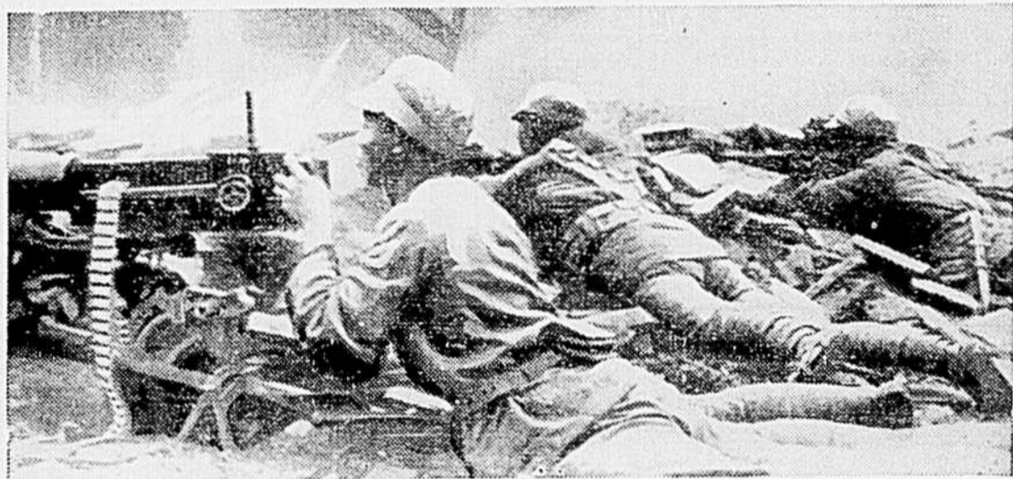
Changteh, Chine—Le fracas de la bataille secouait le sol lorsque "Newsreel" Wong prit cette remarquable photographie durant la bataille de Changteh, ville stratégique située au coeur même du bol de riz de la Chine. Changteh a changé de mains à quatre reprises en l'espace de quarante jours et le massacre y fut effarant. La bataille se termina par la défaite des Japonais. Ce fut leur pire défaite de la guerre de Chine. Les troupes chinoises qu'on voit ici ont subi leur entraînement sous la direction des Américains.