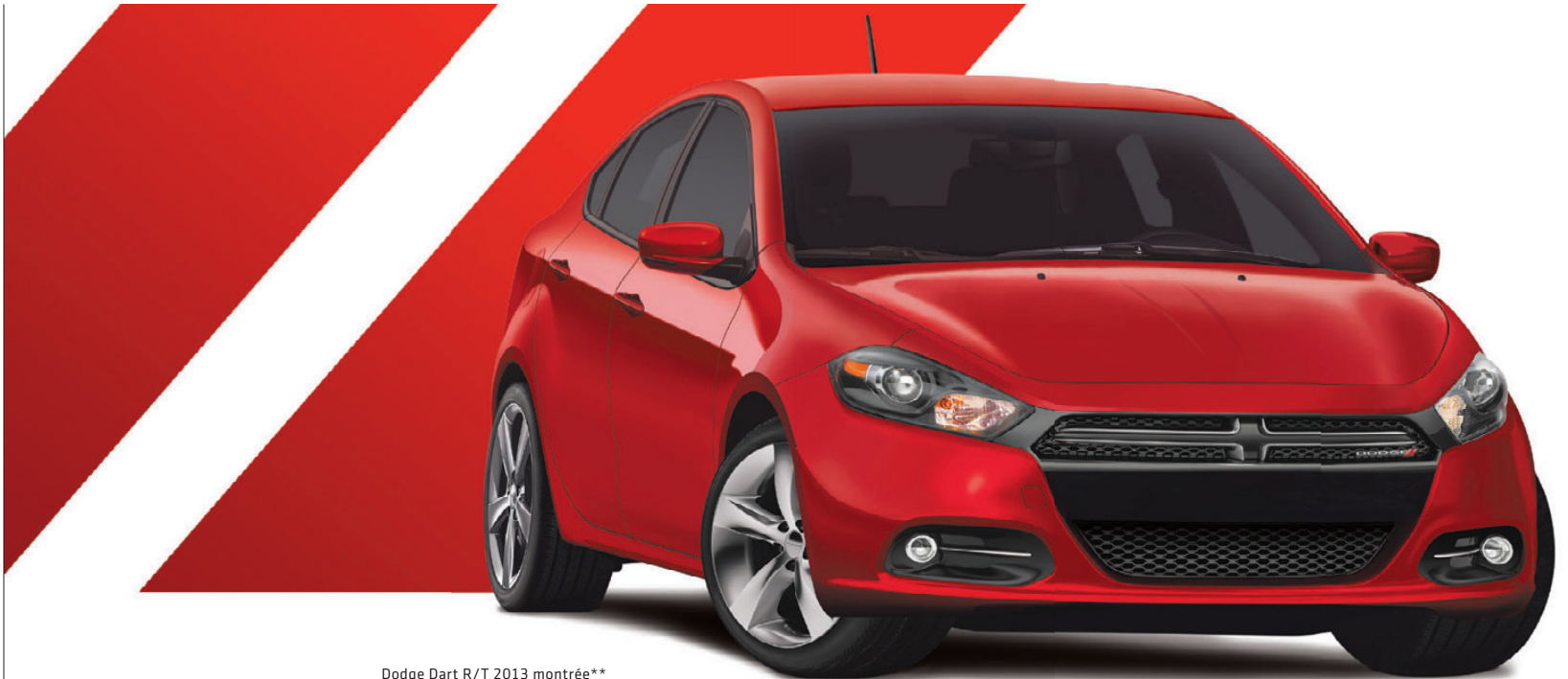
Dodge Dart R/T 2013 montrée**

LES CONCESSIONNAIRES DU MOYEN ET GRAND PAYS DU CANADA