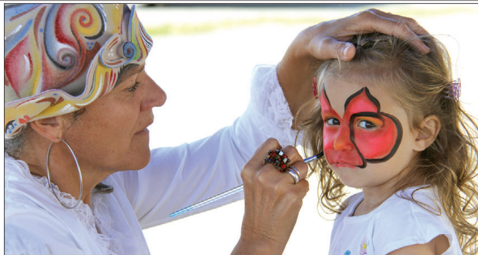
Magnifiques maquillages pour enfants.