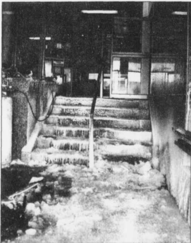
Le hall d'entrée de la Banque de Nouvelle-Écosse.

« On doit récupérer et naturaliser la rivière », soutient l'organisme Rivière Vivante