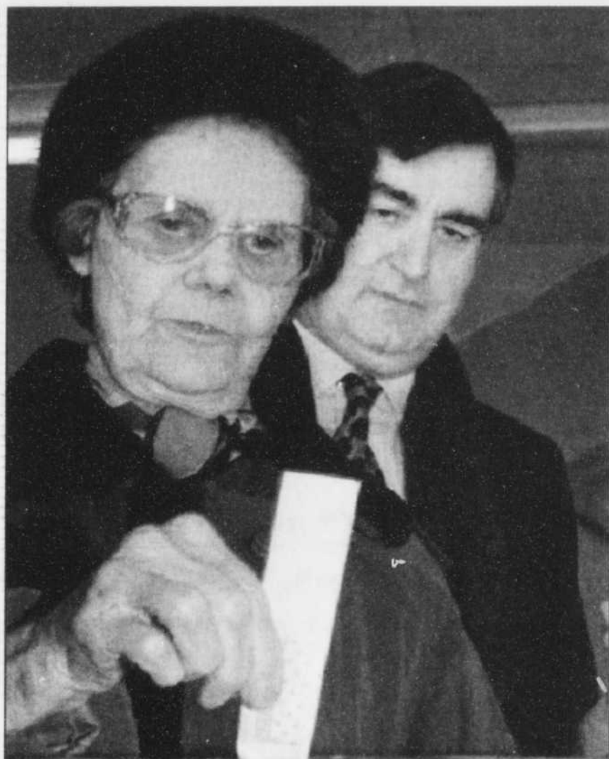
Sous l'oeil attentif de son fils, la mère de Lucien Bouchard glisse son bulletin de vote dans la boîte de scrutin, dans le comté de Jonquière, où le premier ministre s'est facilement fait élire hier.