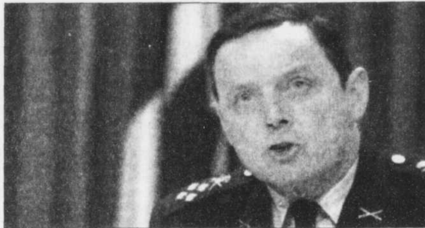
Le général John de Chastelain était alors d'avis que le Régiment aéroporté « était tout désigné pour la tâche ».

Mais au début de décembre, alors que le régiment s'apprêtait à partir et qu'un navire de ravitaillement mouillait au large de Bossasso, la mission changeait complètement d'allure, suite à la décision américaine de créer une force d'intervention multinationale. Le Canada a tout fait pour y participer, et le déploiement prévu à Bossasso a été bouleversé: le régiment partait maintenant pour le centre de la Somalie, plus perturbé par les violences.