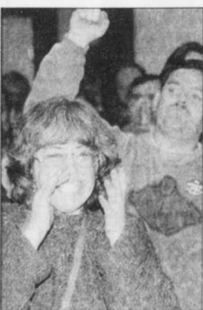
Des syndiqués heureux du vote.

Le syndicat s'oppose aux coupes d'emplois