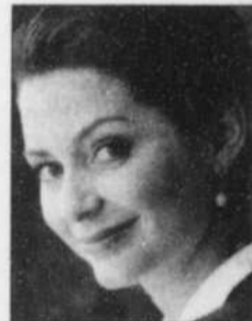
Une spécialiste REER de la Banque Royale

COMMUNIQUEZ AVEC UN DES SPÉCIALISTES REER DE LA BANQUE ROYALE. 1 800 263-9191