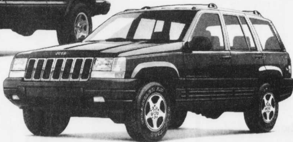
Jeep Grand Cherokee Laredo 1996, 4 X 4

499$* par mois (transport inclus) Terme de 30 mois CLÉ D'OR