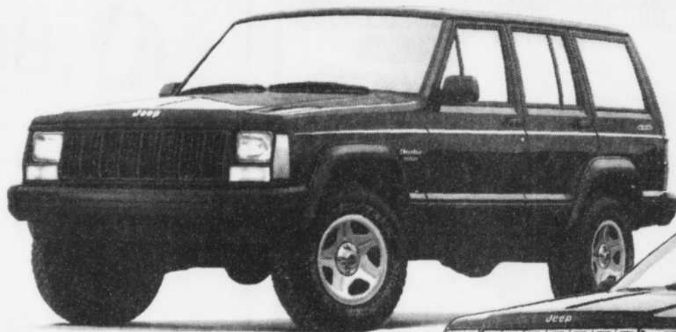
Jeep Cherokee Sport 1996, 4 portes, 4 X 4

399$* par mois (transport inclus) Terme de 30 mois CLÉ D'OR