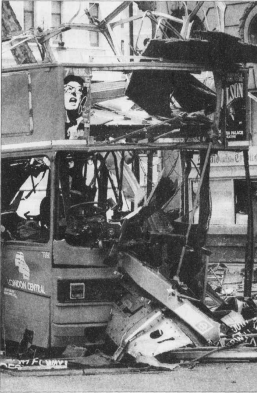
Voilà les restes de l'autobus à deux étages qui a explosé dimanche soir sous l'effet d'une bombe de l'IRA dans le quartier des théâtres de la capitale britannique.

Selon l'Irish Times , bien informé sur ces questions, l'IRA serait désormais commandée par un ancien membre du Sinn Féin au passé militaire sanglant dont il ne fournit pas le nom. Son accession au pouvoir expliquerait et confirmerait un retour à la guerre totale contre la présence britannique en Ulster.