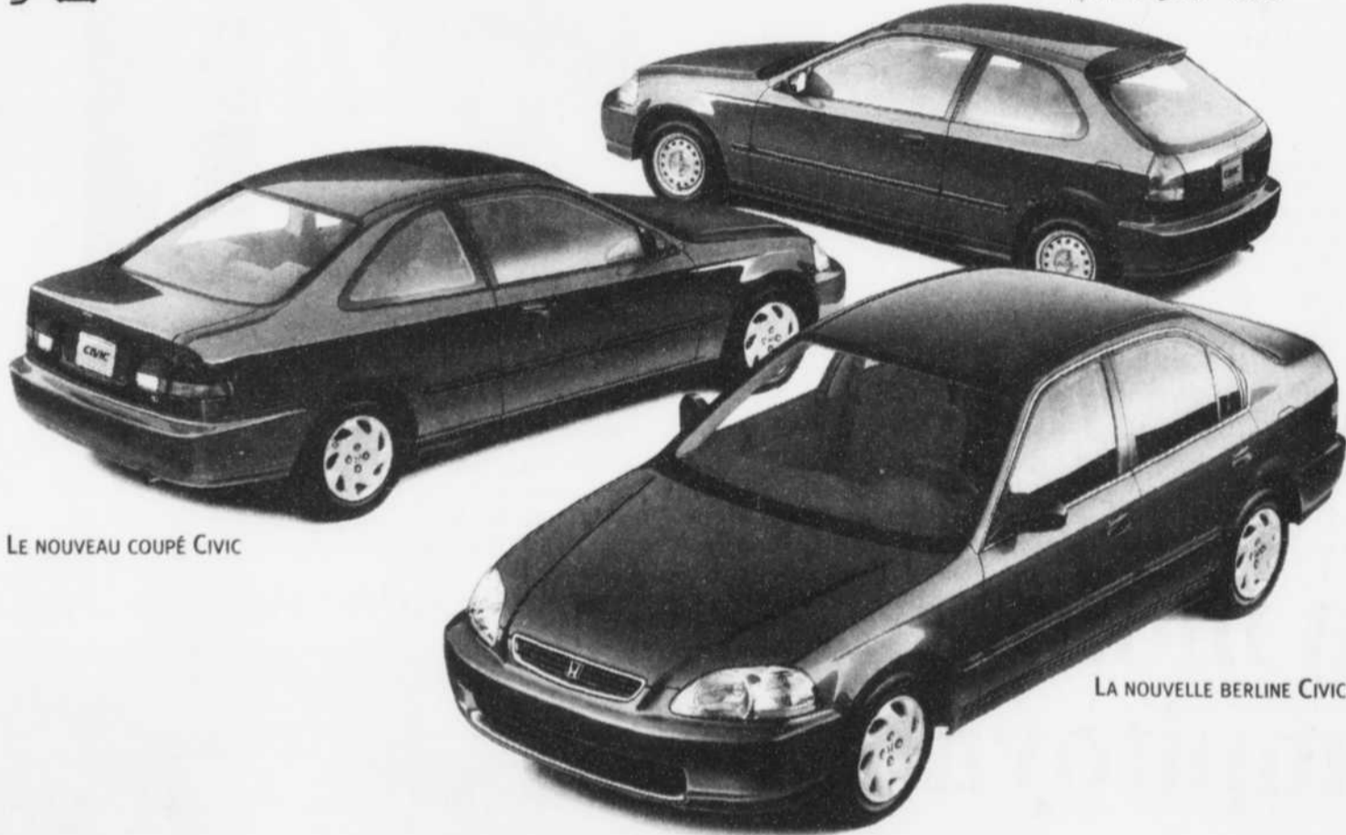
LE NOUVEAU COUPÉ CIVIC