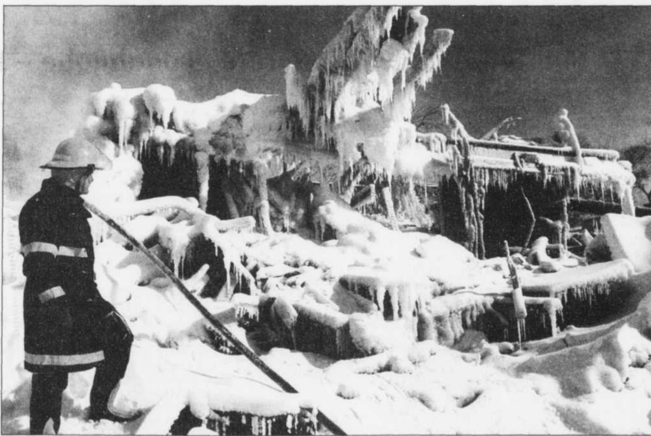
Les ruines de l'édifice donnaient l'allure d'une immense sculpture sur glace, hier.