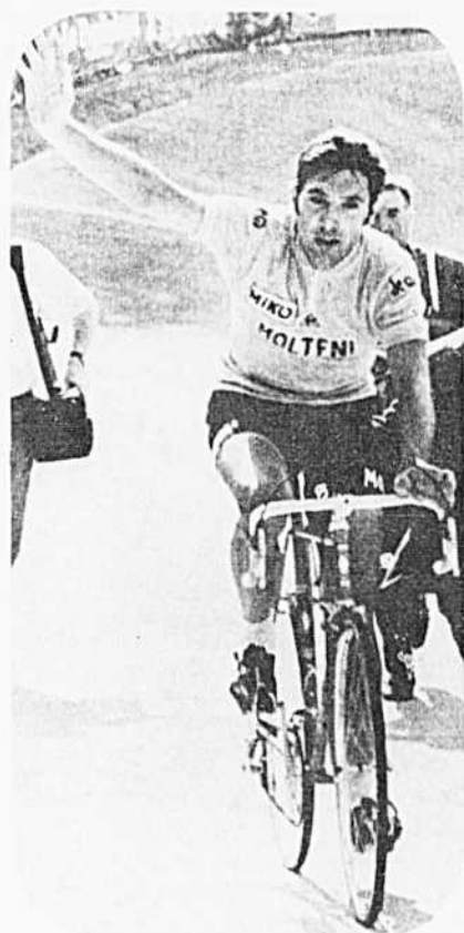
Le Belge Merckx, un des grands noms du cyclisme international, participera aux championnats cyclistes qui se déroulent à Montréal à compter de cette semaine. Merckx est ici photographié à la ligne d'arrivée du Tour de France en 1971, épreuve qu'il avait d'ailleurs remportée.