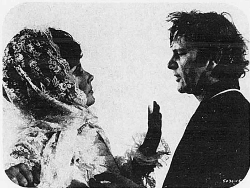
Elizabeth Taylor et Richard Burton dans "Boom"