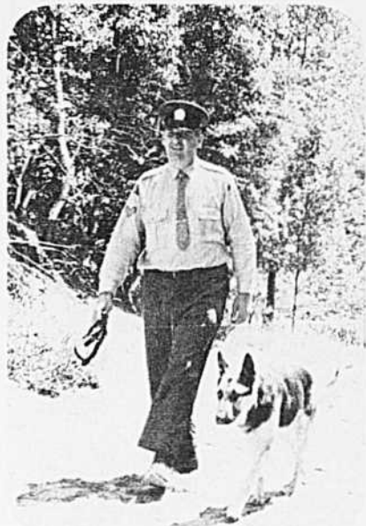
Une scène qui, à peu de choses près, deviendra familière aux téléspectateurs.