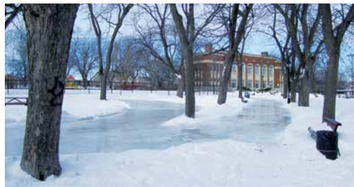
Patinoire décorative du parc Laurier

PARC SIR-WILFRID-LAURIER : sports d'équipe (3) et patin libre