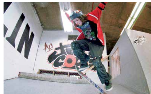
Camp de skateboard au JMCourt