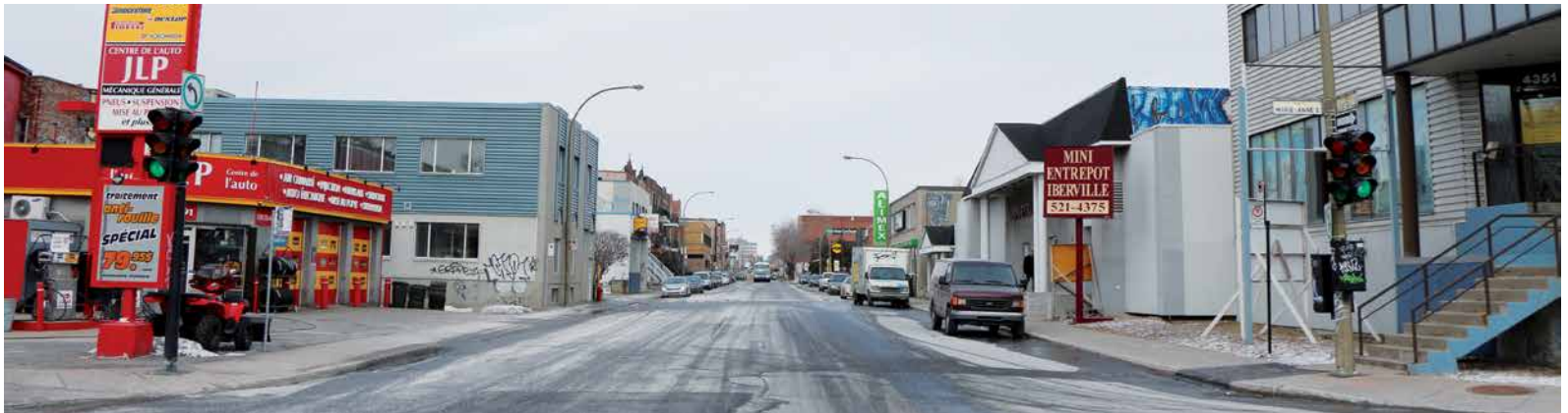
La rue D'Iberville, au nord de Marie-Anne, présente une facette méconnue du Plateau.