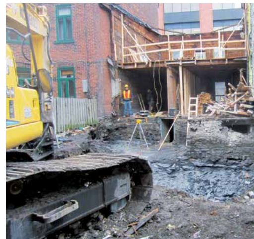
De 2009 à 2013, l'arrondissement a étudié et autorisé, en moyenne, la démolition et le remplacement de seulement 4 à 5 bâtiments résidentiels par année.

Après l'adoption d'une réglementation visant à protéger les commerces de coin en mars, et saluée par le Conseil du patrimoine de Montréal, l'arrondissement introduit, en septembre, de nouvelles exigences réglementaires en matière de démolition d'immeubles, afin de protéger le patrimoine bâti. Les démolitions déguisées sont pratiquement devenues impossibles et les pénalités sont énormes.