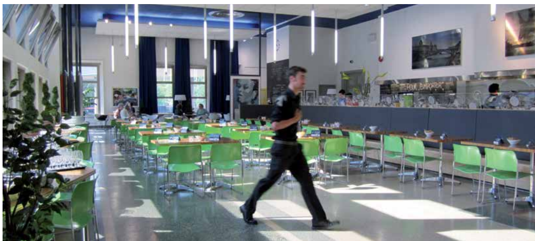
Espace La Fontaine

Renseignements : info@espacelafontaine.com ou 514 280-2525