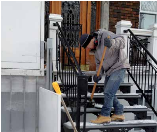
L'an dernier, une trentaine de personnes à mobilité réduite ont profité du service de déneigement d'appoint.

En mars 2013, les élus de l'arrondissement et le Regroupement des activistes pour l'inclusion au Québec (RAPLIQ) lancent un projet-pilote de déneigement d'appoint pour des personnes vivant avec des contraintes de mobilité importantes. Le mandat est confié à l'organisme Spectre de Rue dans le cadre d'un programme destiné aux jeunes en réinsertion sociale (TAPA).