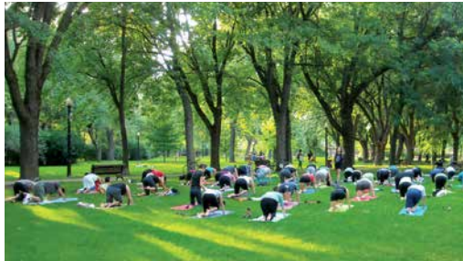
Le yoga dans le parc Baldwin connaît un fort succès.

Depuis quelques années, Le Plateau-Mont-Royal crée des lieux de rassemblement, de création et d'animation de l'espace public. Après les pianos publics, présents depuis deux étés déjà, d'autres projets interactifs naissent en 2013 : poésie urbaine, lecteurs dans les parcs, théâtre de Guignol, halte piétonne sur rue, activités de loisirs dans les parcs, etc. Sous le thème Le Plateau s'anime! , plus d'une vingtaine d'activités sont menées en collaboration avec des partenaires : quelque 12 200 personnes participent aux activités d'animation et plus de 600 personnes assistent aux événements de presse. L'année se termine en beauté avec le projet Ici un souvenir en novembre et les sapins musicaux en décembre.