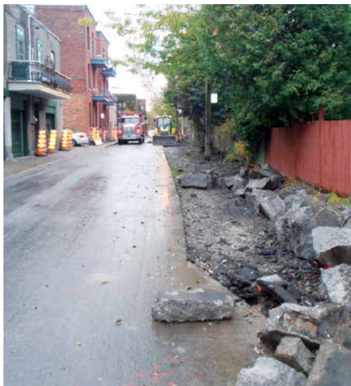
Les travaux embelliront la rue Saint-Christophe et apaiseront la circulation. Un rêve de voisins enfin réalisé.

Par ailleurs, l'arrondissement remporte deux prix, en juin 2013, au concours Vers des rues plus conviviales : les meilleures mesures d'apaisement de la circulation dans la région métropolitaine de Montréal , organisé par le Regroupement national des conseils régionaux de l'environnement du Québec, le Conseil régional de l'environnement de Montréal et leurs partenaires. Sont récompensés l'agrandissement du parc Baldwin par la fermeture de la rue Marie-Anne Est ainsi que l'aménagement de la piste cyclable et le verdissement de la rue Rachel, en partenariat avec la Ville centre.