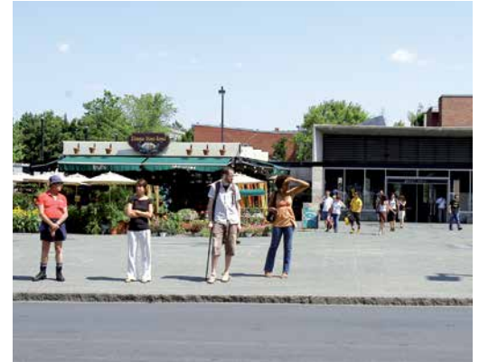
La place Gérald-Godin : un espace public à repenser.

Dans les prochains mois, l'arrondissement invitera ses partenaires et les citoyens à prendre part à l'élaboration d'une vision d'aménagement de cette place afin de bénéficier du potentiel créatif et participatif de sa population.