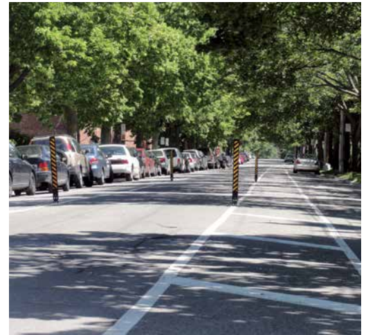
Rue Parthenais, au nord de Laurier Est : le rétrécissement de la voie de circulation au moyen de marquage au sol et de l'installation de balises incite les conducteurs à être plus attentifs et à réduire leur vitesse.

Pour sécuriser les déplacements sur l'avenue Laurier, l'arrondissement installe en décembre des panneaux d'arrêt à trois intersections et retire les feux de circulation à l'une d'entre elles. Si les résultats sont concluants, cette mesure pourrait être mise de l'avant sur d'autres rues.