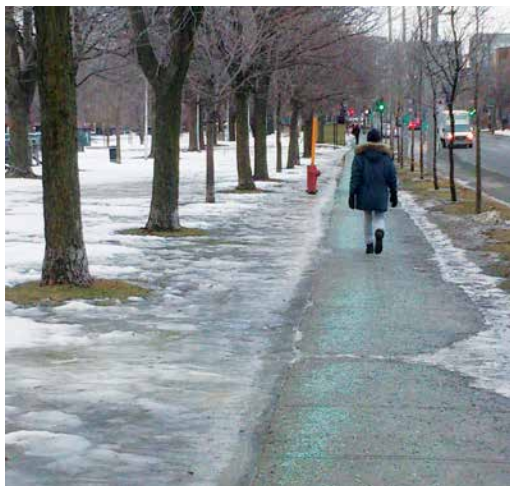
Selon la température, le fondant est ajouté au sel solide ou à un mélange sel-gravier.

C'est quoi le vert sur les trottoirs? Nos équipes utilisent un sel de déglacage qui agit plus vite et plus longtemps. Ce fondant approuvé par l' Environmental Protection Agency (EPA) comprend du sel, du chlorure de magnésium liquide et un colorant, dont la couleur varie selon le fabricant.