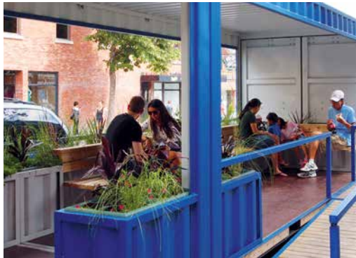
Des passants viennent chercher un peu d'ombre à la halte piétonne du boulevard Saint-Laurent.

Avec un budget supplémentaire de 100 000 $ cette année, Le Plateau s'anima encore plus en 2014. Surveillez l'infolettre et regardez bien autour de vous !