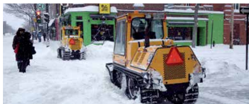
Parfois, une seule chenillette ne suffit pas pour effectuer le déblaiement.

Peut-on mettre la neige d'une propriété privée sur le domaine public? C'est interdit, à moins d'obtenir, à certaines conditions, un permis de dépôt de neige qui doit être affiché sur la propriété. Les dépôts illégaux sur le domaine public causent d'importants amoncellements de neige, souvent après le passage de nos équipes. Vous pouvez signaler cette situation en téléphonant au 311.