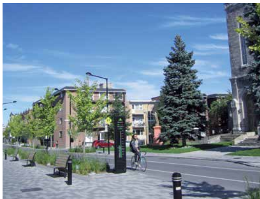
Depuis le 14 février 2013, près de 700 000 passages cyclistes ont été enregistrés devant le métro Laurier. Détails : laurier.montreal.visio-tools.com

La conception et la gestion serrée du réaménagement de l'avenue Laurier à l'interne ont permis à l'arrondissement de réaliser des économies de 500 000 $ sur un budget de 4,3 M$. La seconde phase de réaménagement de l'avenue, entre le boulevard Saint-Laurent et la rue Saint-Denis, qui comprendra l'élargissement du trottoir nord et la plantation de 40 arbres, sera réalisée en 2014. Ces travaux prévus en 2013 ont été reportés en raison des nouvelles dispositions liant la Ville et les arrondissements à la décision de l'Autorité des marchés financiers (AMF) dans l'octroi des contrats.