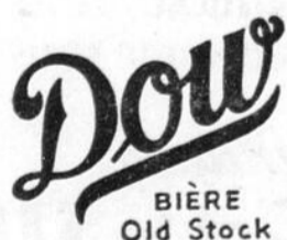
BIÈRE Old Stock