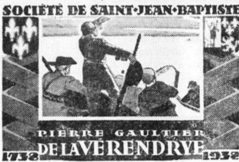
PIERRE GAULTIER DE LA VERENDRYE

De retour au pays, il s'engagea dans le commerce des fourrures. C'est pendant qu'il était au lac Nipigon qu'il conçut l'idée d'explorer cette vaste contrée qui se trouve au delà du lac Supérieur et d'aller à la découverte de la Mer de l'Ouest. (suite à la dernière page)