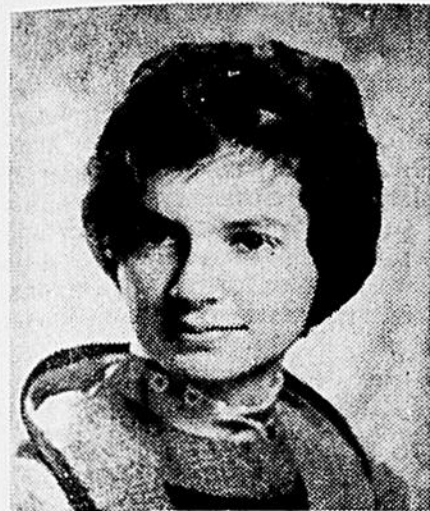
Studio Basil Zarov