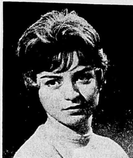
Studio J.-N. Gaudreault