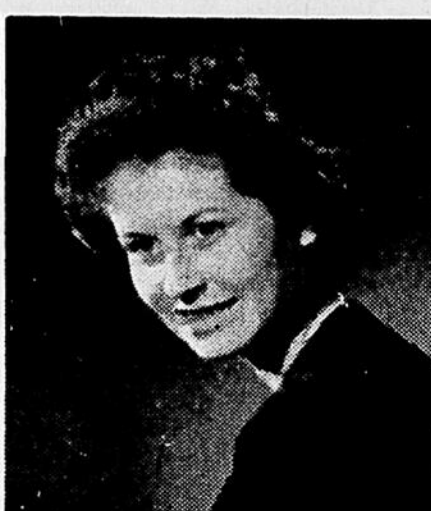
Studio J. N. Gaudreault