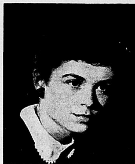
Studio J.-N. Gaudreault