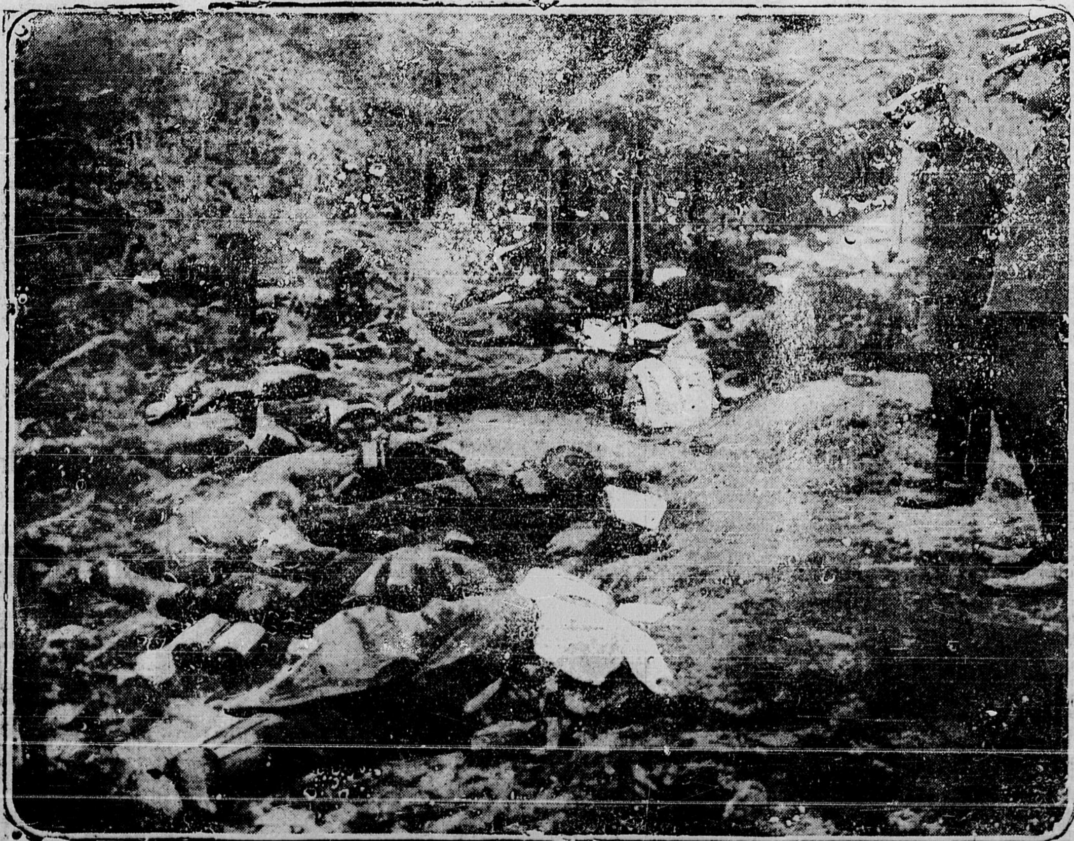
GRAVURE MONTRANT COMBIEN SONT NOMBREUSES LES VICTIMES DES GRANDES BATAILLES MODERNES. LES CADAVRES QUE L'ON VOIT SONT CEUX DES SOLDATS DE L'INFANTRIE FRANÇAISE TUES DANS LES BOIS DE NISME PRÈS DE PERONNE. DES OFFICIERS DIRIGEANT LES SOLDATS CHARGES DE L'INHUMATION CONTEMPLANT CE TRISTE SPECTACLE.

GEO. DUNCAN, agent des passagers pour la ville et agent général pour les voyageurs par bateaux à vapeur.