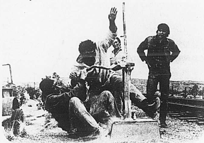
Antony Quinn, dans "Flap".