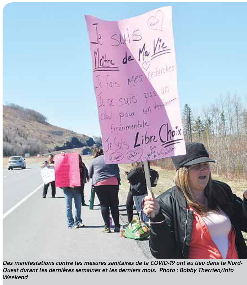
Des manifestations contre les mesures sanitaires de la COVID-19 ont eu lieu dans le Nord-Ouest durant les dernières semaines et les derniers mois.

« Ce que les organisateurs des rassemblements contre les ordonnances de santé publique doivent comprendre, c'est qu'il y a absolument un droit de ne pas être d'accord avec les ordonnances, et de l'exprimer. Ce qui n'est pas permis, c'est de mettre la sécurité publique en danger. Sachant à quel point les variants se propagent, à quel point ils ont un impact sérieux sur nos services de santé, il est imprudent d'organiser ces rassemblements. Tout comme il serait imprudent d'organiser un « rallye automobile contre