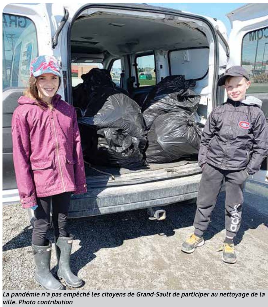
La pandémie n'a pas empêché les citoyens de Grand-Sault de participer au nettoyage de la ville. Photo contribution