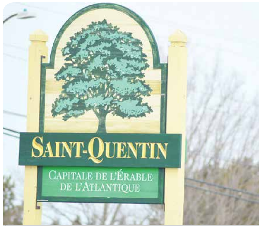
À Saint-Quentin, le projet d'annexion d'une partie du DSL de la paroisse à la Ville n'a pas obtenu l'appui d'une majorité d'électeurs.

«Je sais qu'en marge de la réforme, la discussion fera surface pour l'ensemble de la population ainsi que du DSL et non uniquement pour les gens domiciliés sur une superficie d'un kilomètre carré.»