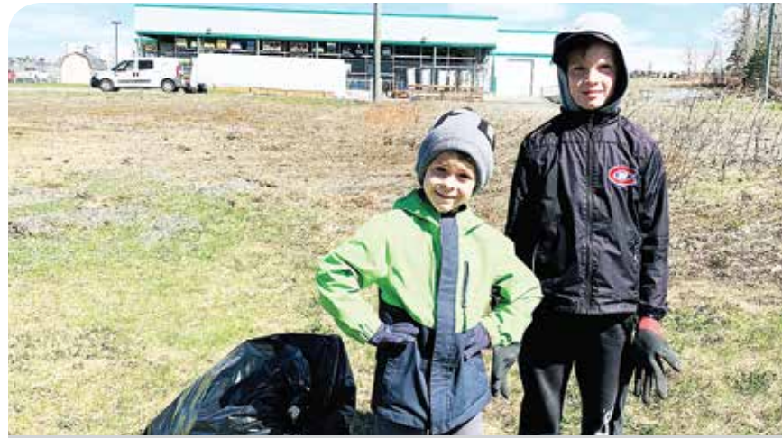
Petits et grands ont eu l'occasion de faire leur part pour l'environnement et leur municipalité. Photo contribution

«J'espère que les gens penseront deux fois avant de jeter des ordures dans les rues ou les fossés.»