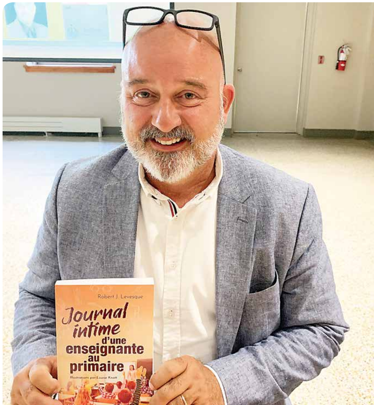
Le volume «Journal intime d'une enseignante au primaire» plongera le lecteur au coeur d'une salle de classe.

«J'ai accumulé plus d'une centaine de scénarios que j'ai transcrits sous forme de journal intime. Je voulais avoir un équilibre entre des situations délicates et d'autres