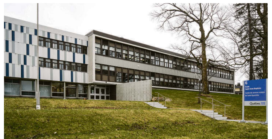
École Saint-Jean-Baptiste à Roxton Falls.

Aucune réfection majeure n'est prévue en 2024.