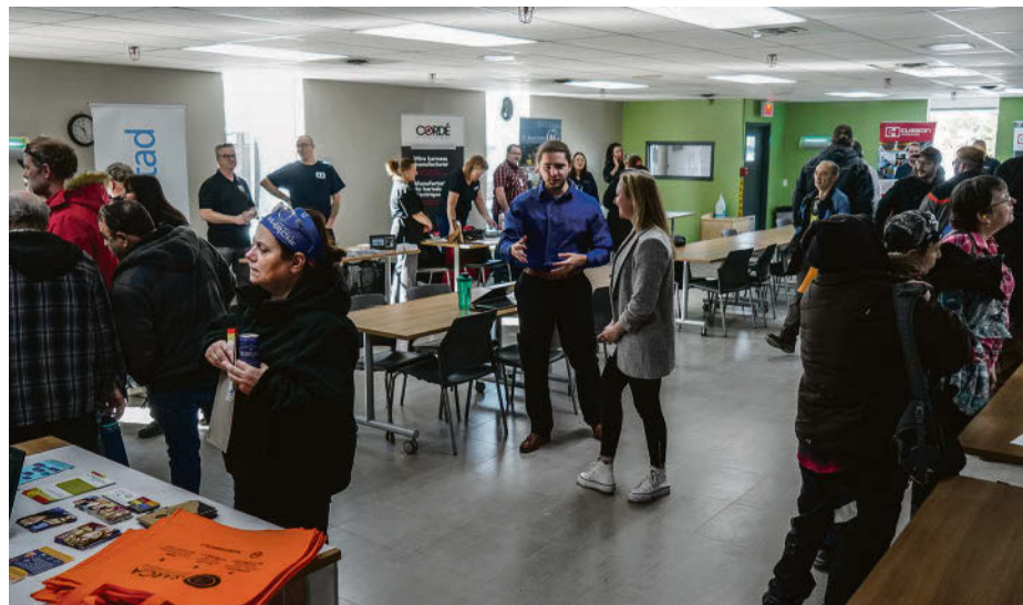
Une foire de l'emploi a rassemblé une quinzaine d'entreprises et d'organismes, toutes prêtes à aider les anciens employés de Roski Composites.

« Nous sommes là pour aider les travailleurs à se replacer et aujourd'hui, plusieurs entreprises présentes offrent de belles conditions de travail pour des postes utilisant des compétences très similaires à celles qui étaient requises chez Roski. Dès la fermeture de l'usine, l'équipe de