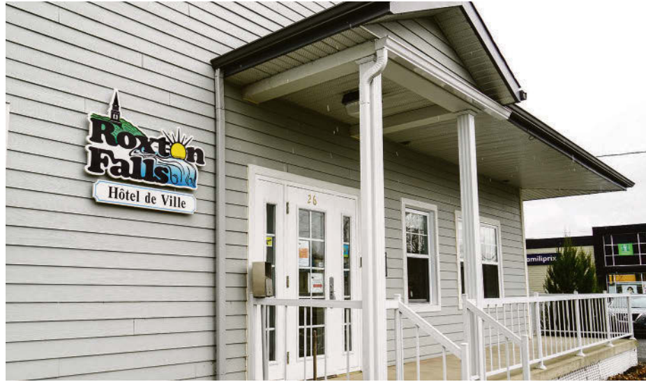
Hôtel de ville de Roxton Falls.

Dans le premier projet, celui d'une vingtaine de résidences unifamiliales, c'est Huard Excavation qui en est le promoteur. Les terrains qui ne sont pas encore vendus sont prévus à la sortie de la municipalité et accessibles par la route 222. Aussi, un