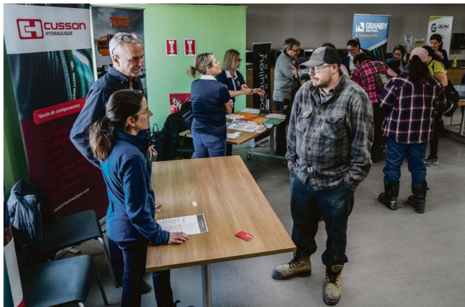
Ici, l'entreprise Cusson Hydraulique, de Saint-Valérien-de-Milton, à la recherche de travailleurs.

Pour finir un secondaire 5, effectuer un retour aux études, faire de la francisation ou retrouver d'anciens bulletins pour faire des démarches d'emploi ou un retour aux études, l'organisme SARCA, à Acton Vale, offrait ses services.