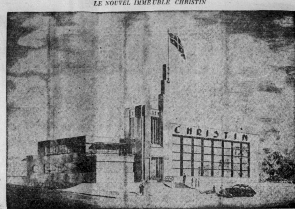
La maison Christin Ltée, la plus vieille compagnie d'eaux gazeuses à Montréal. — elle date de 1855 — vient de faire un pas de plus sur la voie du progrès...