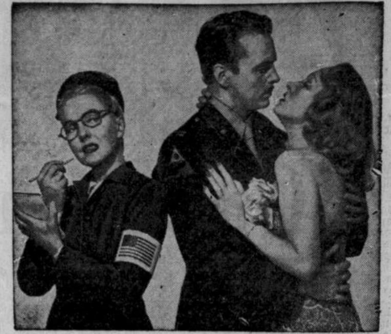
Jean Arthur, la sénatrice, observe d'un oeil réprobateur la "fraternisation" scandaleuse du capitaine Lund et de la belle allemande Marlene Dietrich. Cette scène est tirée du film "A Foreign Affair", qui passe cette semaine au Palace.