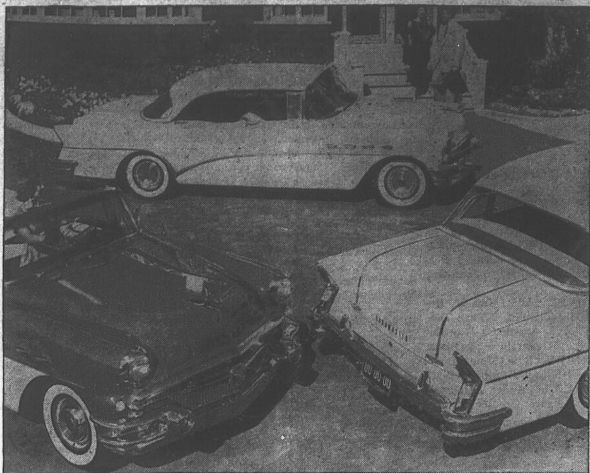
Les modèles Buick Roadmaster et Super de 1956, dont on annonce aujourd'hui la mise sur le marché, présentent une apparence extrêmement élégante et chacune des séries comporte une décapotable à toit rigide. Le nouveau train avant est doté d'une audacieuse grille en forme de V à large écran, de phares nouveaux et d'un nouveau paracoches très original. Le nombre de cv a été augmenté à 265. Le carburateur est du type à quatre cheminées et le taux de compression du moteur est de 9.5 à 1. En ajoutant un nouveau stator à la transmission Dynaflo, on a amélioré les départs et les accélérations et accru l'économie.