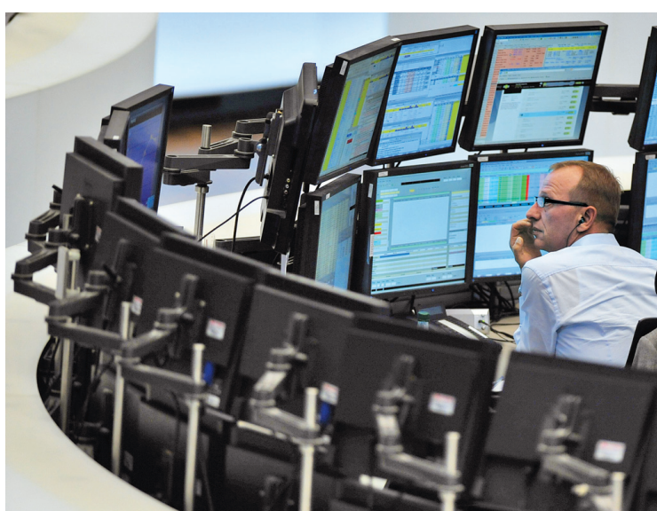
L'homme moderne produit des sommes astronomiques de données numériques.

«Ces données peuvent dresser un portrait autant des besoins que des comportements individuels et collectifs», peut-on lire. Chercheurs et législateurs commencent à réaliser le potentiel qui se trouve derrière la canali-