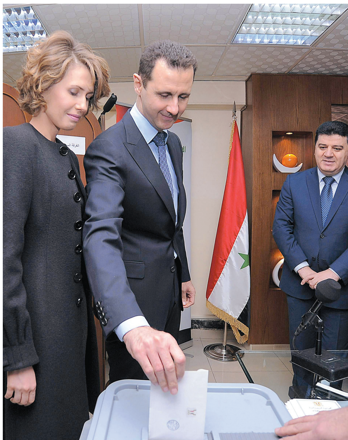
Bachar al-Assad et son épouse Asma, votant hier: «Dieu, la Syrie, Bachar et c'est tout.»