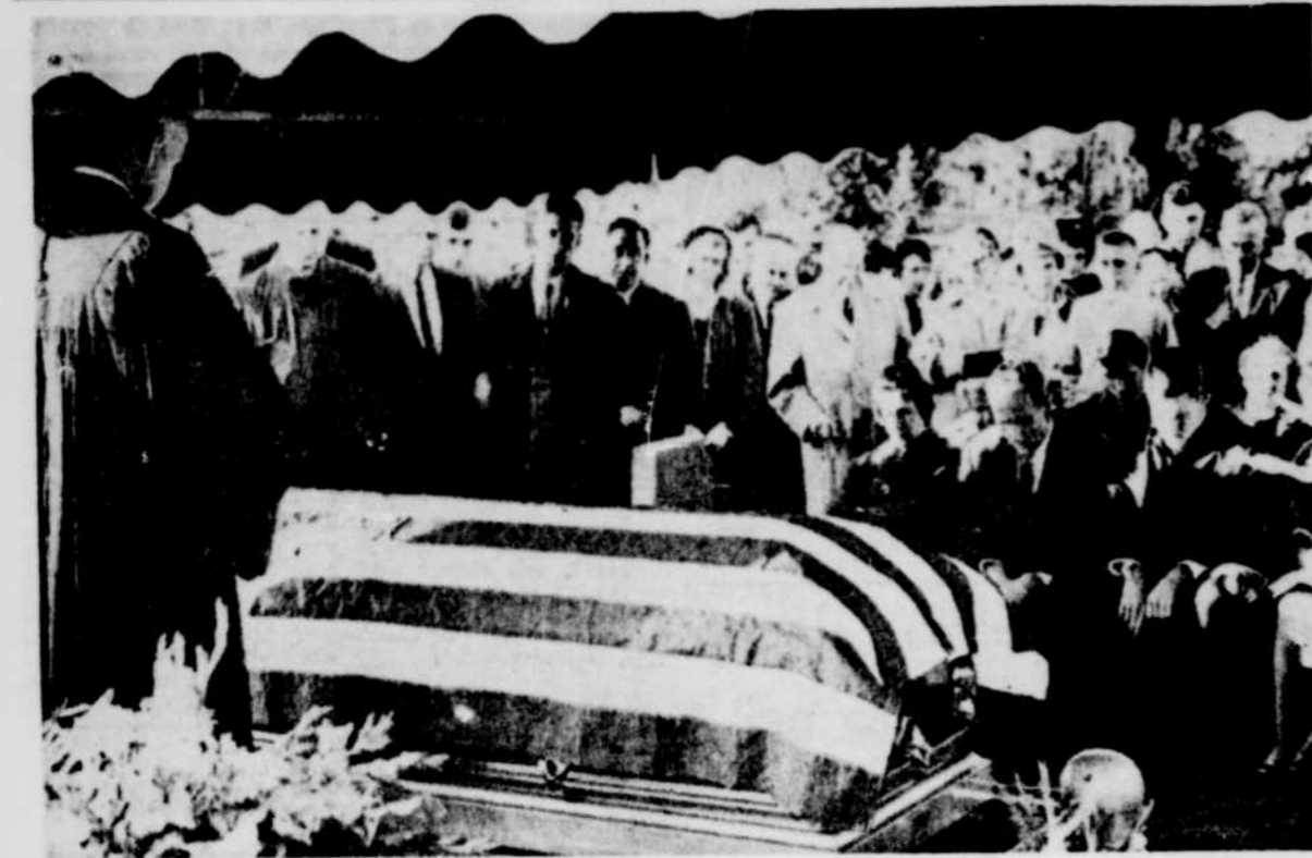
UN DERNIER HOMMAGE à l'ancien gérant Freddie Hutchinson, des Red Legs de Cincinnati, décédé jeudi dernier et inhumé hier, dans un cimetière de Seattle.

TORONTO (PC) — Eddie Powers, ancien arbitre de la ligue Nationale de hockey, a accepté des excuses publiques et un montant d'argent des Canadiens de Montréal, du pilote Toe Blake et du Montréal-Matin, hier, en règlement à l'amiable d'une poursuite en diffamation de caractère.