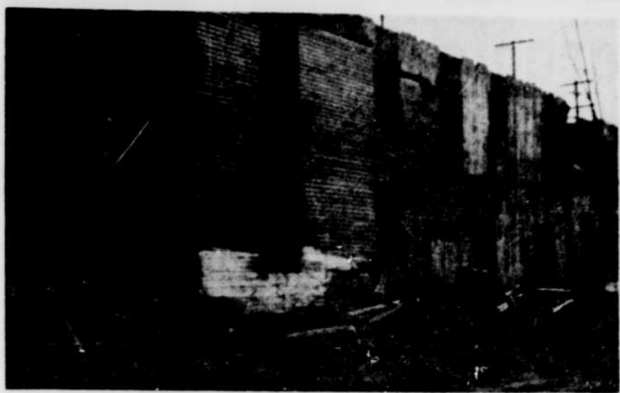
CETTE BATISSE en démolition est tout ce qui reste de ce qui fut jadis la boulangerie de M. Lafamme. Elle doit aujourd'hui disparaître pour faire place au progrès puisqu'il s'agit de prolonger la rue Bellevue en direction de la rue Brook afin de permettre la décongestionnement sur la rue Hériot.

Le conseil consent un montant de $25 à l'oeuvre des petits souliers qui a fait tant de bien l'an dernier dans la municipalité pour les enfants dans le besoin immédiat.