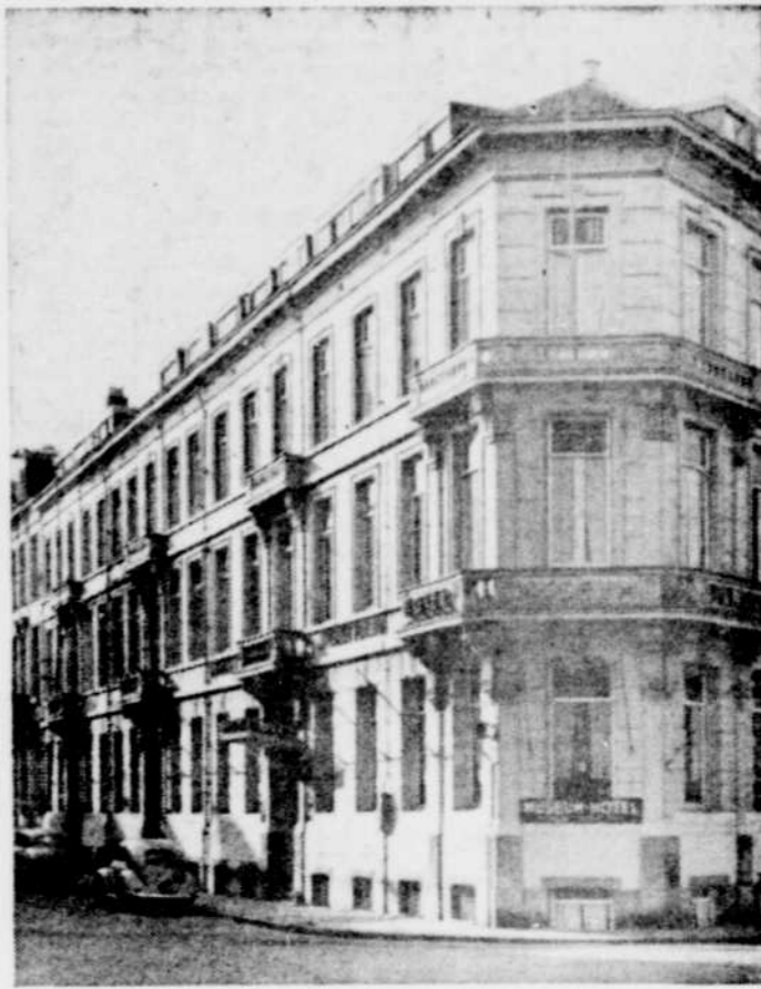
Amsterdam: Le "Museum Hotel", exemple typique des hôtels à $5 par jour.