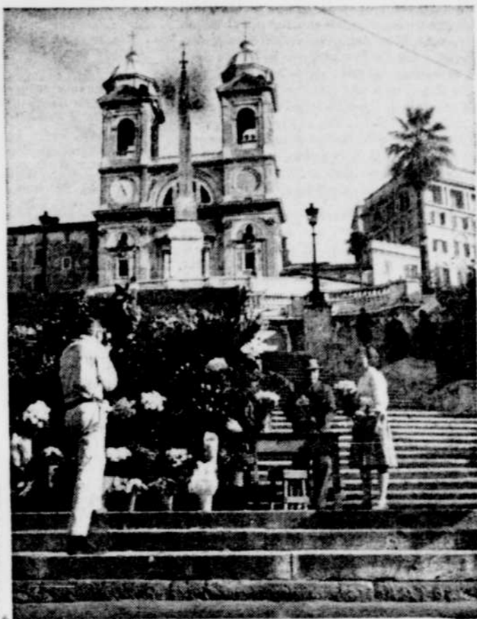
Rome: Ce que vous verrez entre autres pendant votre tour KLM à $5 par jour.