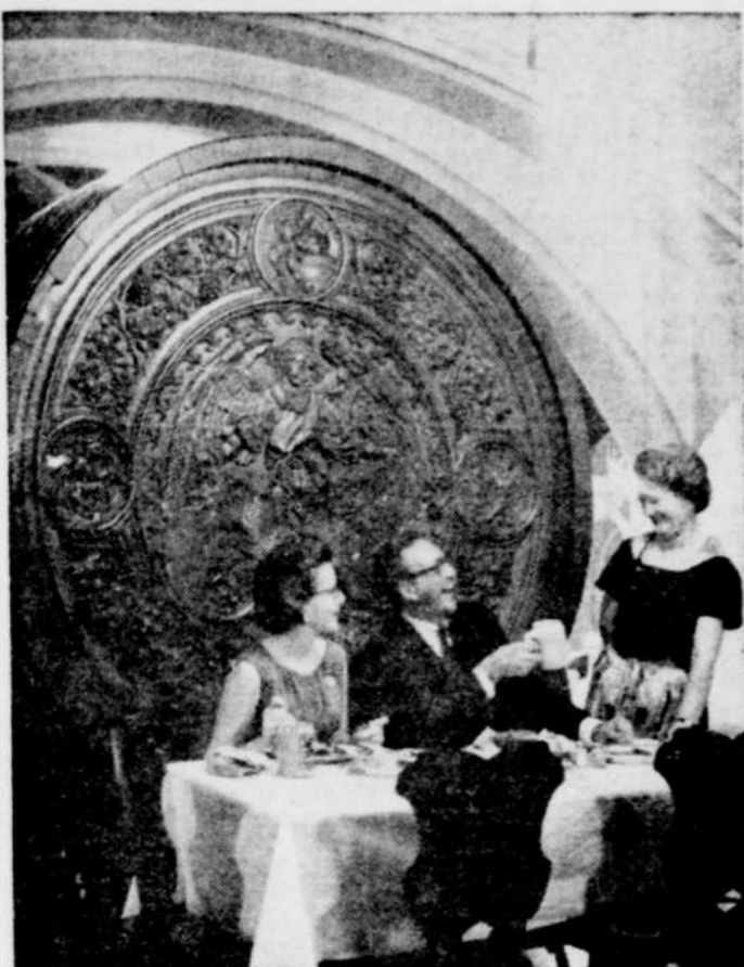
Munich: D'excellents repas dans des restaurants comme celui-ci coûtent moins de $2,00.

La nouvelle Bio-Dyne est offerte sous en onglet, soit en suppositoires sous le nom de Préparation H. Elle est en vente dans toutes les bonnes Pharmacies et s'accompagne d'une garantie de remboursement.